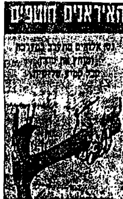
صورة رقم (٥)