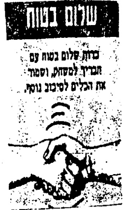
صورة رقم (١)