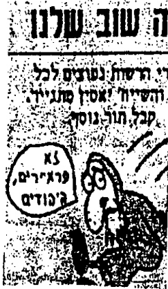
صورة رقم (٣)