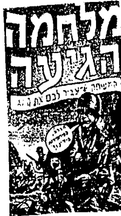
صورة رقم (٢)