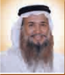
الشيخ أحمد القطان

7- هي التي تفترض في رأيها خطأً وإن رأته صواباً، وفي رأي أخواتها العاملات الصواب وإن ظنته خطأً. 8- كالنحلة العاملة لا تأكل إلا طيباً، وإذا حطت لا تخدش ولا تكسر، ولها شوكة ولكن للأعداء.