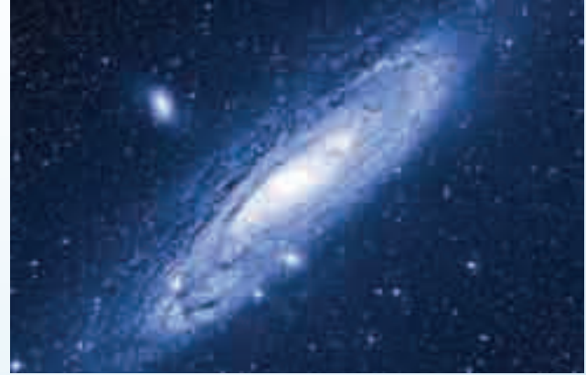
مجرة حلزونية تسبح في هذا الكون الواسع وهي تجري باستمرار مع مليارات النجوم

ثم إن كلمة "يدور" التي نجدها في مقالاتهم غير صحيحة على الإطلاق، لأن حركة الشمس والقمر والأرض والنجوم والكواكب والمجرات والغبار والغاز الكوني... جميعها تتحرك حركة اهتزازية مركبة أشبه ما تكون بجسم يطفو على سطح الماء وتحركه الأمواج حركة تعرجية.