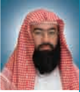
الشيخ نبيل العوضي