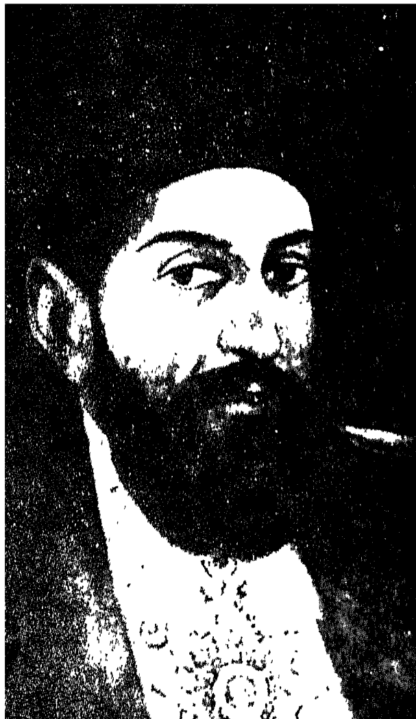
( السلطان عبد الحميد الثاني )