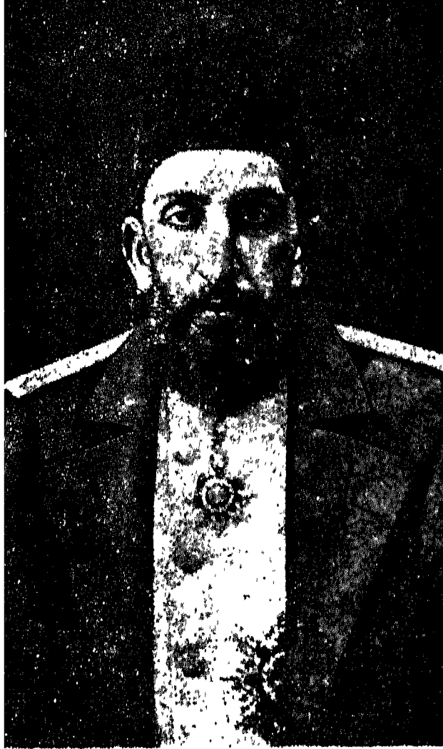
(السلطان عبد الحميد الثاني)