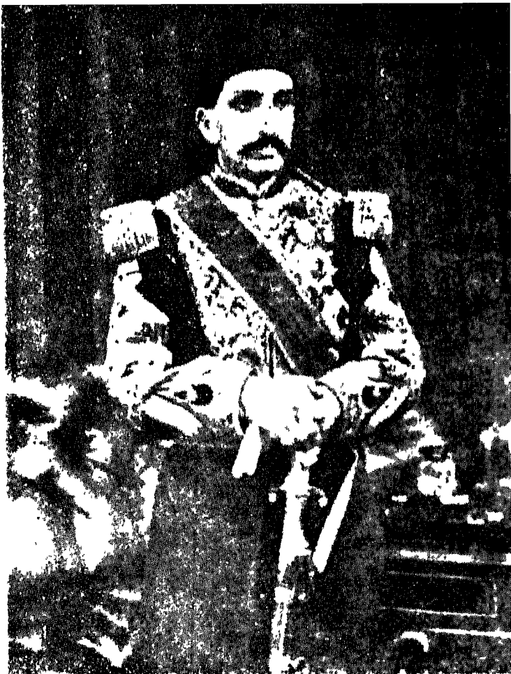
( السلطان عبد الحميد الثاني في شبابه )