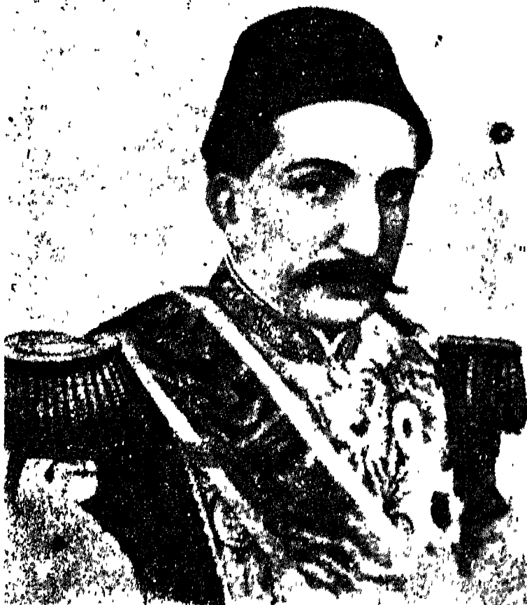
( السلطان عبد الحميد الثاني في شبابه )