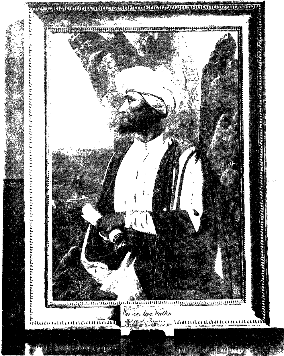
المؤلف جورج أوغست قالين بلباسه العربي . ( عن صورة زيتية في متحف فنلاند الوطني - ملك جامعة هاسنكي )