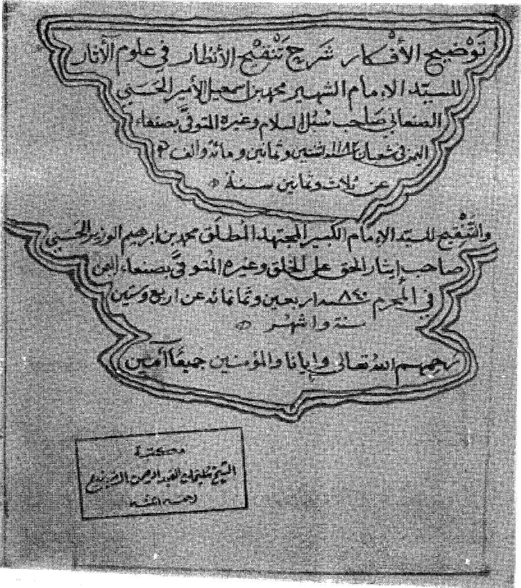
صفحة العنوان من « س »