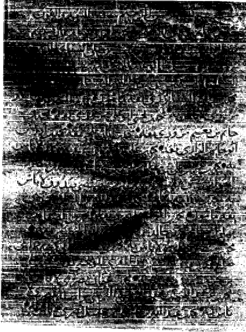
الورقة الأولى من المخطوطة