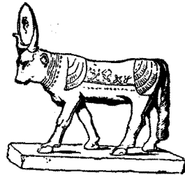
تمثال "أبيس" العجل المقدس في مصر القديمة، نقلاً عن كتاب قاموس الكتاب المقدس/ص 607.

لقد عرفت عبادة العجل في معظم الشرق القديم، وكان للمصريين النصيب الأكبر من عبادته، وقد كان من أبرزها "أبيس" (Apis) (67) الذي يمثل القوة والصراع في الحرب والخصب.