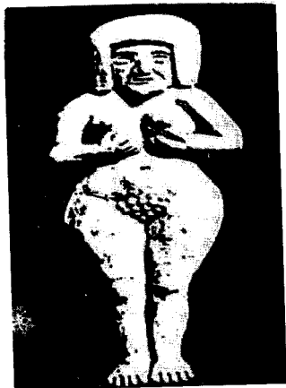
تماثيل "الترافيم"

القتل، هربته زوجة ميكال بنت الملك شاول التي وضعت هذه الآلهة في فراش زوجها داود: ((11) فَأَرْسَلَ شَاوُلُ رُسُلًا إِلَى بَيْتِ دَاوُدَ لِيُرَاقِبُوهُ وَيَقْتُلُوهُ فِي الصَّبَاحِ. فَأَخْبِرَتْ دَاوُدَ مِيكَالُ امْرَأَتُهُ قَائِلَةً: «إِنْ كُنْتُ لَا تَنْجُو بِنَفْسِكَ هَذِهِ اللَّيْلَةَ فَإِنَّكَ تُقْتَلُ غَدًا» (12) فَأَنْزَلَتْ مِيكَالُ دَاوُدَ مِنَ الْكُوَّةِ فَذَهَبَ هَارِبًا وَتَجَا (13) فَأَحْدَتْ مِيكَالُ التَّرَافِيمَ وَوَضَعَتْهُ فِي الْفِرَاشِ، وَوَضَعَتْ لِبَدَةَ الْمِعْزَى تَحْتَ رَأْسِهِ وَغَطَّتْهُ بِثَوْبٍ)). " (1) صموئيل 19/11-13"