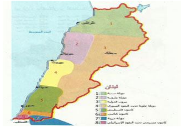
خريطة تقسيم لبنان