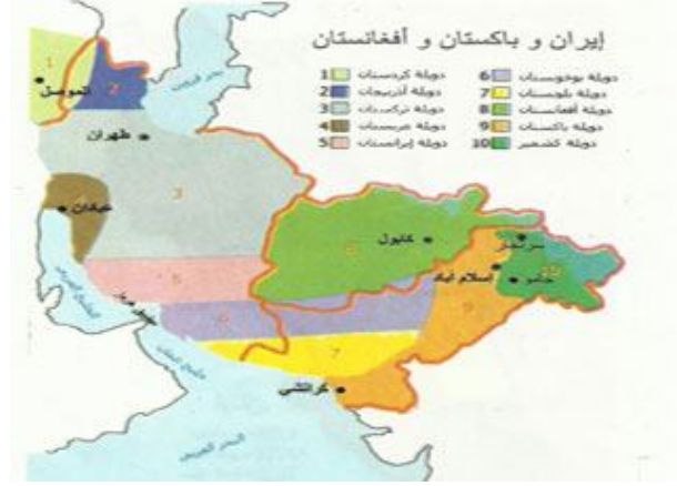
خريطة تقسيم ايران وباكستان وافغانستان

کردستان .أذربيجان .تركستان .عربستان .إيرانستان (ما بقي من إيران بعد التقسيم)بوخونستان . بلونستان .أفغانستان (ما بقي منها بعد التقسيم) .باكستان (ما بقي منها بعد التقسيم) .كشمير .