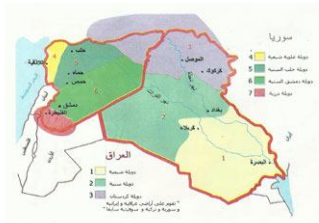
خريطة تقسيم سوريا العراق

4- دولة الدروز في الجولان ولبنان (الأراضي الجنوبية السورية وشرق الأردن والأراضي اللبنانية).