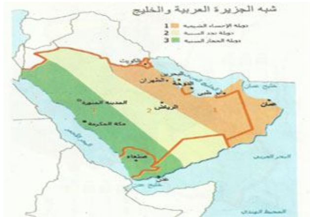
خريطة تقسيم الجزيرة العربية ودول الخليج