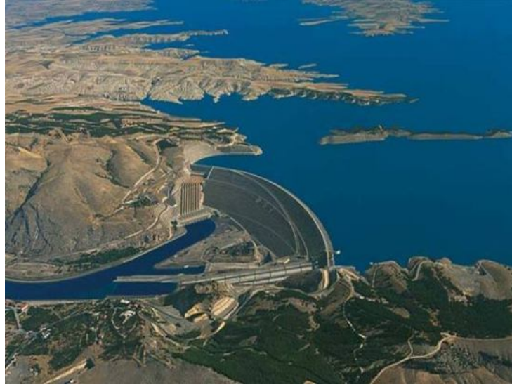
سد أتاتورك العملاق

ومن أهم سدود مشروع الغاب سد أتاتورك وقد دشن هذا السد في يوليو 1992م، ويقع السد على نهر الفرات على بعد 24 كلم من مدينة أورفة، وهو يعد الثالث في العالم من حيث حجم قاعدته البالغة 84.5 م3، والثامن من حيث الارتفاع 190 م والخامس عشر من حيث حجم المياه في بحيرة السد، والثامن عشر من حيث إنتاج الطاقة الكهربائية .