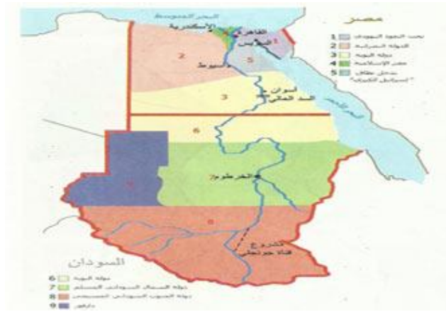
خريطة تقسيم مصر والسودان

وقد نجح الأمريكان وإسرائيل والغرب بمساعدة نظام مبارك وبعض الأنظمة العربية الأخرى في فصل جنوب السودان عن شماله وإنشاء دويلة جديدة مسيحية في جنوب السودان ، ولا شك أنهم في البداية سيدعمون هذه الدويلة الناشئة بالمال والسلاح ، ثم يستخدموها بعد ذلك في إشعال الحروب والتواغات بين دويلة شمال السودان المسلمة أو دويلة دار فور التي ماتزال المؤامرات مستمرة لفصلها عن السودان بعد الجنوب مباشرة حيث إنها غنية باليورانيوم والذهب والبتروول .