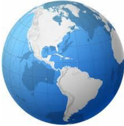
خريطة الكرة الرضية و يظهر بها القارتين الأمريكيتين الشمالية والجنوبية من الخلف

وفيما يلي خريطتان للكرة الأرضية يتضح منها أن آسيا وأوروبا وأفريقيا تقع على الخريطة من الأمام والأمريكيتين تقعان على الخريطة من الخلف .