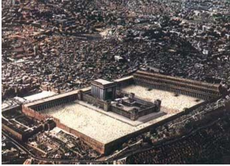
صورة الهيكل اليهودي الذي يخطط اليهود لبنائه على أنقاض المسجد الأقصى

ثالثاً: نبوءات الكتاب المقدس عن حلف الآشوري وأثرها على الخطط الصهيونية والأمريكية والغربية لتدمير العراق وفرض الحصار على إيران وليبيا والسودان ومنع تسليح الدول الإسلامية :