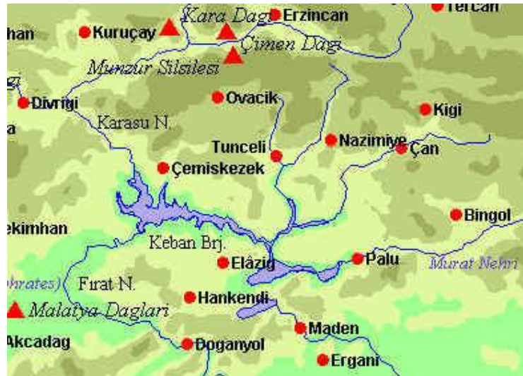
خريطة لمشروع الغاب الذي يضم حوالي 22 سدا

هذا ما قلته عام 1997 م بالطبعة الأولى الصادرة عام 1998 م وكذلك بالطبعة الثانية الصادرة عام 2002 م ، والآن بدأت المياه المتدفقة لنهري دجلة والفرات في السنوات الأخيرة في الانخفاض بسبب مشاريع السدود التي تبنيتها تركيا علي النهيرين . فقد قاربت تركيا علي الانتهاء من مشروعها الإستراتيجي بجنوب شرق الأناضول المعروف بمشروع الغاب الذي يمر نهري دجلة والفرات به قبل وصول مياههما للأراضي العراقية والسورية ، ويتألف مشروع الغاب من 22 سداً و 19 محطة للطاقة الكهربائية ومشروعات أخرى متنوعة في قطاعات الزراعة والصناعة والمواصلات والسري والاتصالات، ومشروع الغاب من حيث المساحة هو أضخم مشروع في العالم، ويشمل ثمانى محافظات وعند إتمامه تقارب مساحة الزراعة المروية من خلاله 8.5 مليون هكتار أي نحو 19 ٪ من مساحة الأراضي المروية في تركيا، وتوفير 106 مليون فرصة عمل جديدة في هذه المناطق ذات الأكثرية الكردية. كما سيساهم المشروع في إنتاج 118 مليار كيلو واط/ ساعة أي 22 ٪ من الطاقة الهيدروكهر ومائة لتركيا .