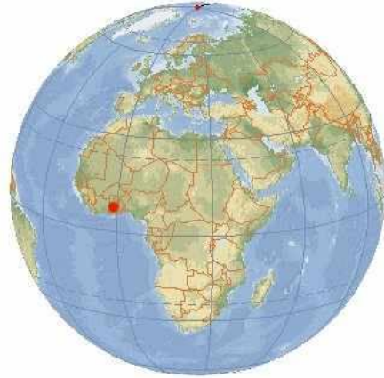
خريطة الكرة الأرضية و يظهر بها قارات أفريقيا وآسيا وأوربا في واجهة الخريطة