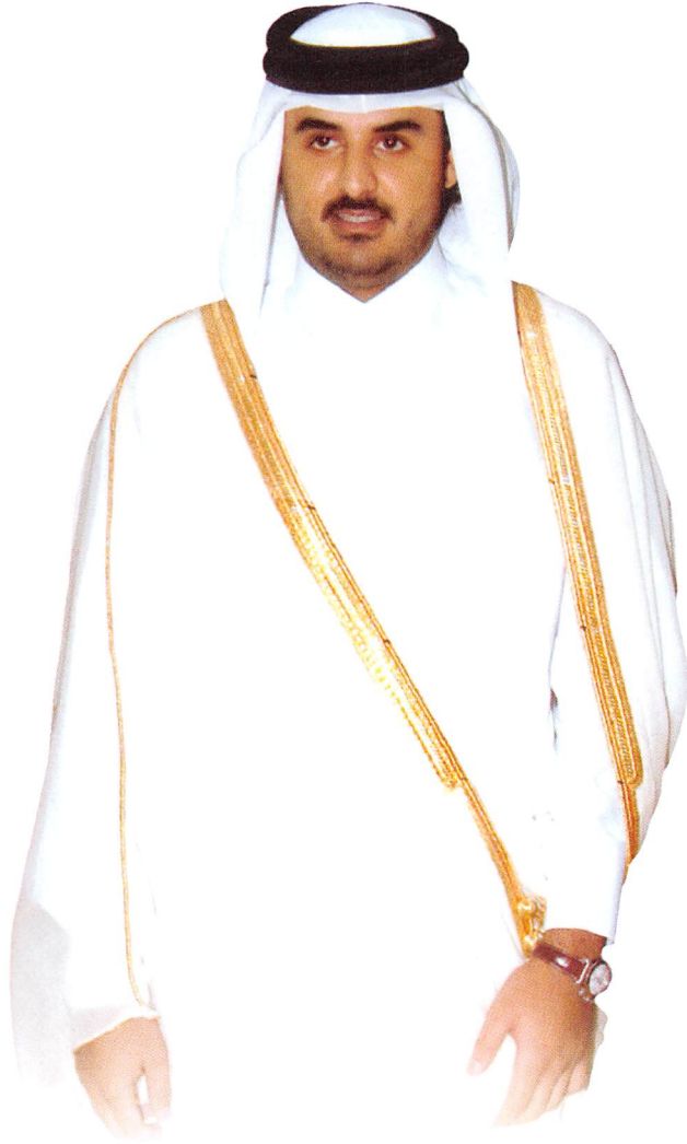
سمو السيخ عيسى بن محمد آل نافي ولي العهد الأمين