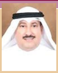
خليفة الأذينة الوكيل المساعد بوزارة الأوقاف