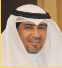
إعداد: محمد جميل الشمري

بها وعُرفت بهم، يعملون في صمت ابتغاء مرضاة الله تبارك وتعالى.. و«البشرى» إذ تسجل أسماءهم في سجل الشرف الدعوي، وتقف على رحلاتهم العلمية والدعوية، وأبرز إنجازاتهم وتجاربهم، تقسح لهم صفحاتها ليسدوا نوائجهم الدعوية للمسلمين وغير المسلمين.. وتقدم في كل حلقة داعياً وداعية.