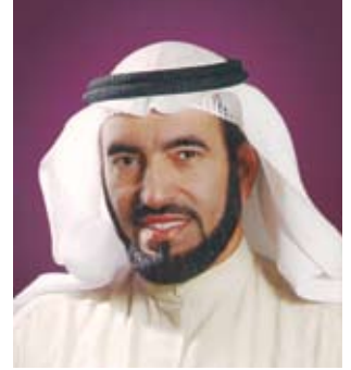
د. طارق سويدان المفكر الإسلامي