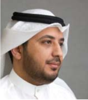
مشاري ناصر العرادة منشد وإعلامي