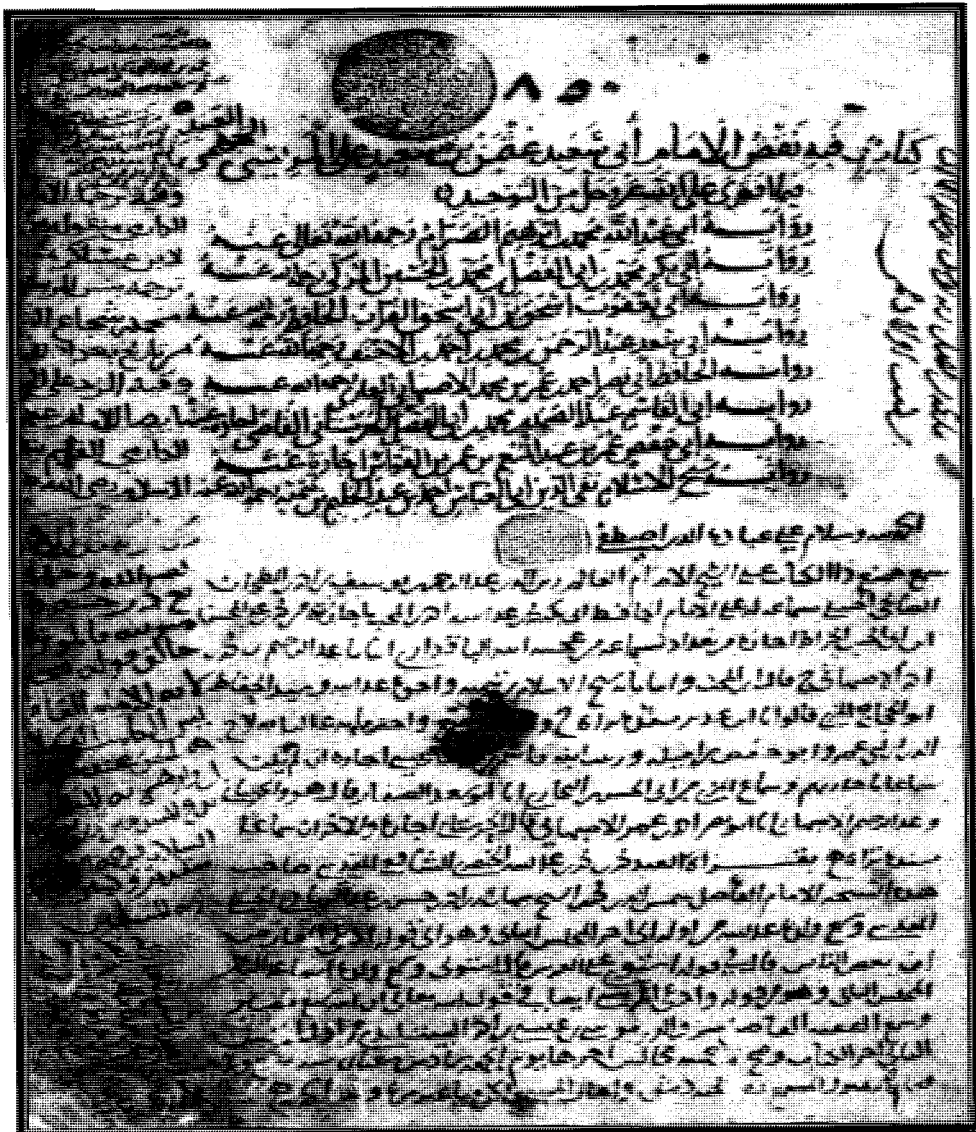
الصفحة الأولى من المجموع وعليها عنوان كتاب النقض، ويظهر عليها الساعات، وعلى اليسار الإشارة إلى وجود كتاب الرد على الجهمية ضمن المجموع.