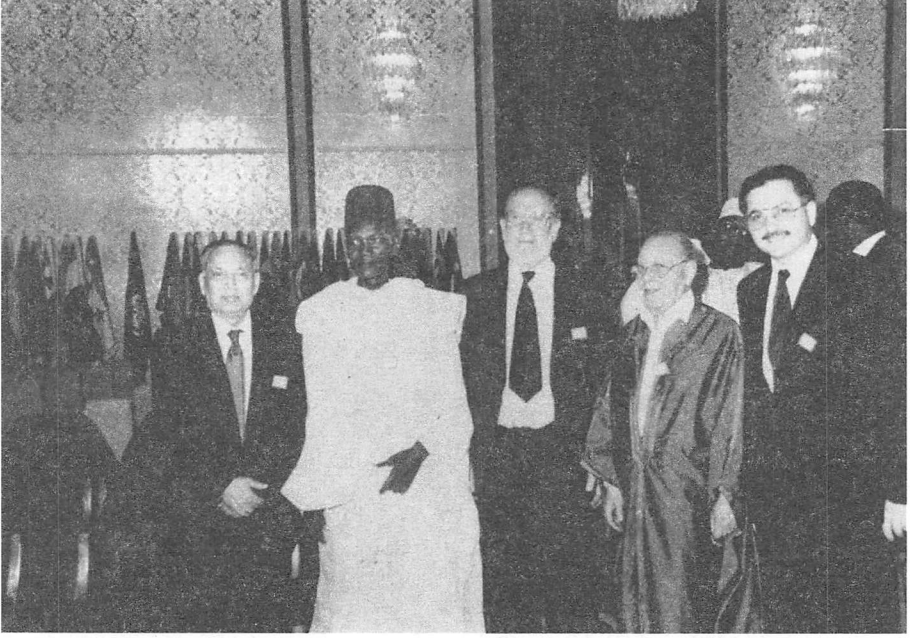
صورة جماعية للأمناء العامّين لمنظمة المؤتمر الإسلامي، من اليسار إلى اليمين: شريف الدين بيرزاده (باكستان) ١٩٨٥-١٩٨٨م، أحمدو كريم جاي (السنغال) ١٩٧٥-١٩٧٩م، حسن التهامي (مصر) ١٩٧٤-١٩٧٥م، الحبيب الشطي (تونس) ١٩٧٩-١٩٨٤م، والبروفيسور أكمل الدين إحسان أوغلي (تركيا) ٢٠٠٥م- الوقت الحاضر.