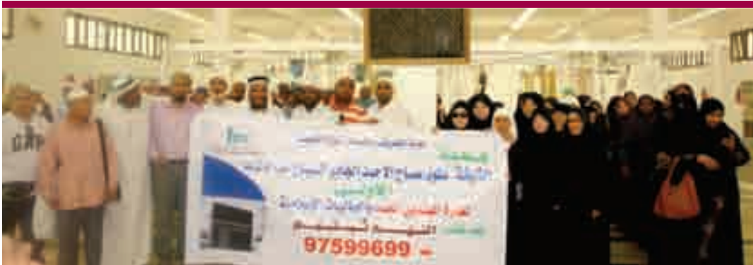
زيارة كسوة الكعبة