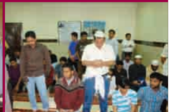
صلاة الظهر والعصر جمعاً وقصرًا