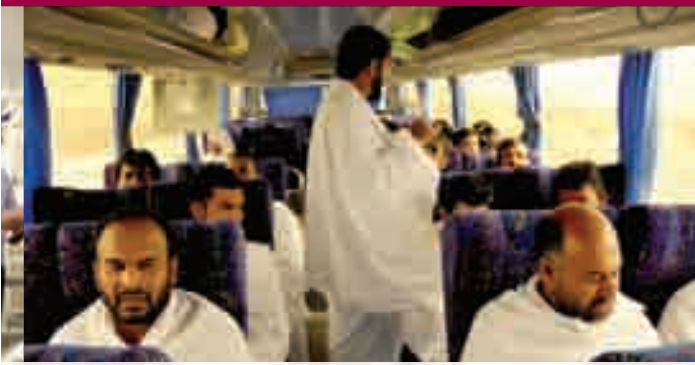
المعتمرون يرددون «لبيك اللهم لبيك.. لبيك لا شريك لك لبيك...»