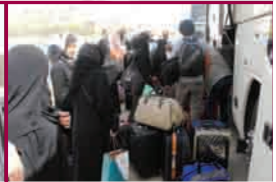
المهتمون في حالة استعداد للمغادرة