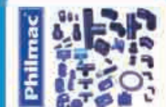
Plant Caring Products

شركة بن نصف للتجارة العامة والمقاولات BIN NISF Gen. Trad. & Contr.Co.