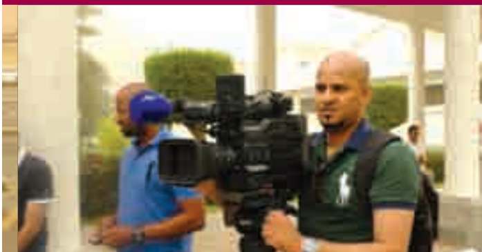
فريق التصوير مع المهتدين في مصنع الكسوة