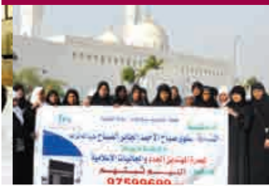
المعترون في مسجد القبلتين