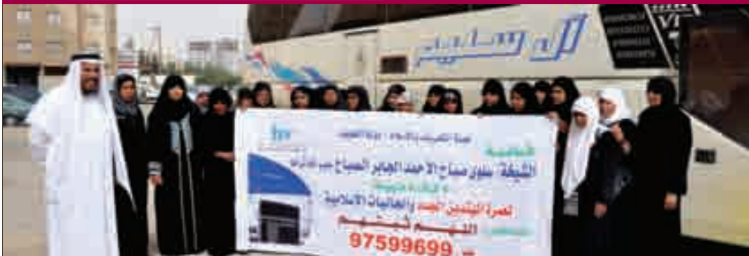
حمد لله على السلامة