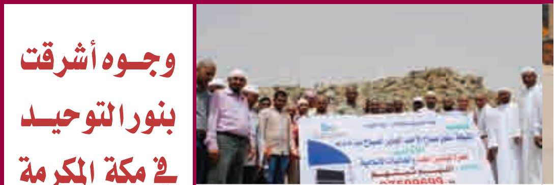
زيارة جبل الرحمة بعرفات