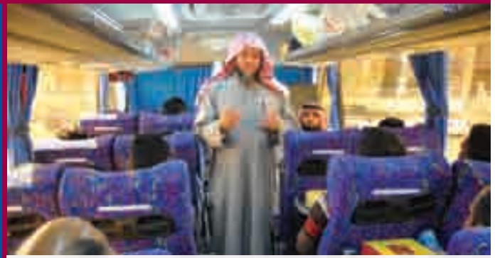
المهتمون يرددون دعاء السفر قبل بدء الرحلة