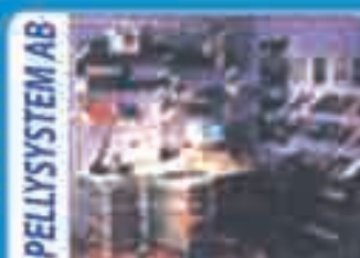
Shelving... Power Tools