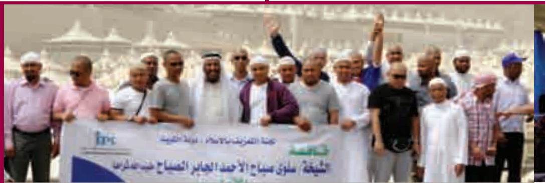
المهتدون في منى