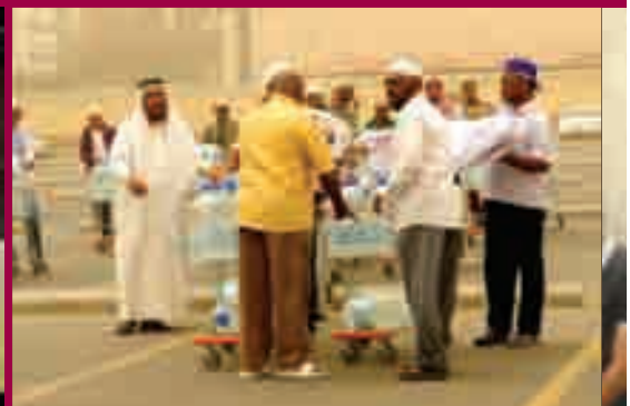
ماء زمزم للمهتدين