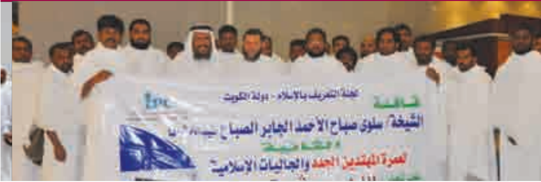
إدارة الحج والعمرة في استقبال القافلة الثانية في فندق "أبراج زمزم" بمكة