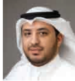
مشاري ناصر العرادة منشد وإعلامي