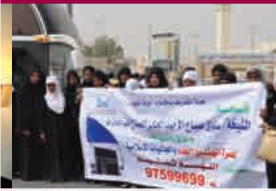
المهتديات في ميقات قرن المنازل