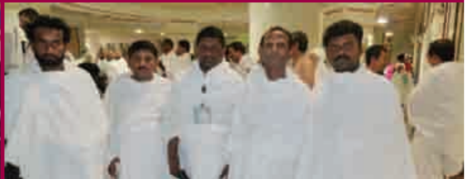
المهتدون والمهتديات بعد قضاء مناسك العمرة