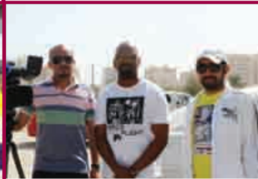
فريق التصوير في تلفزيون الكويت مرافقاً للمعتمرين