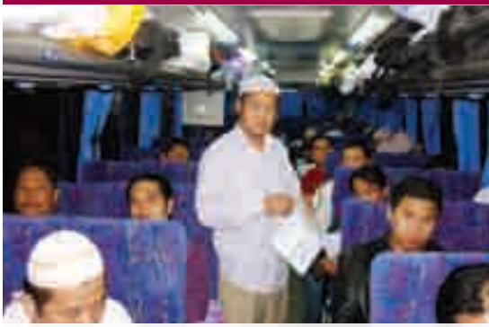
محاضرة حول فضل العمرة والحج