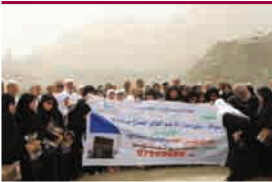
زيارة جبل ثور