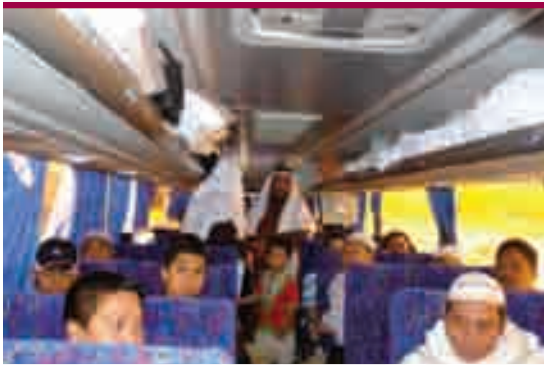
مدير الحج والعمرة يطمئن على المهتمين قبل المغادرة