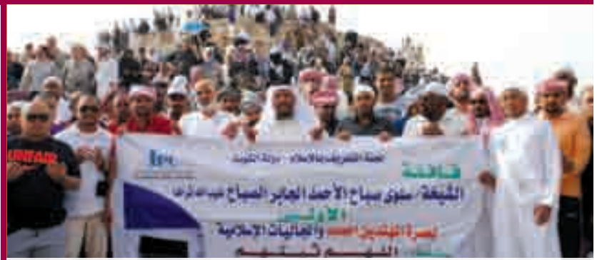
المهتدون يدعون للكويت أميراً وحكومةً وشعباً عند جبل أحد