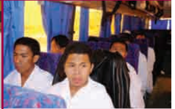
المهتدون في الطريق إلى مكة