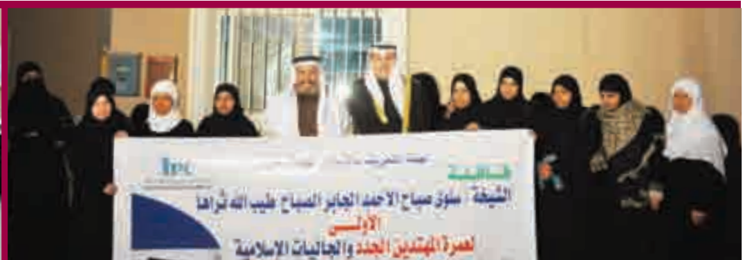
الشيخ فيصل الحمد الصباح في وداع المهتمين