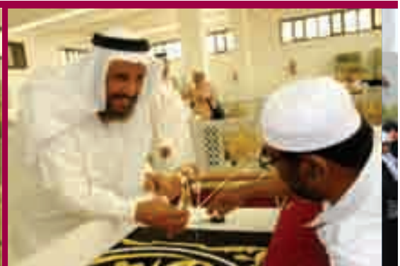
مداعبة أحد العاملين بكسوة الكعبة