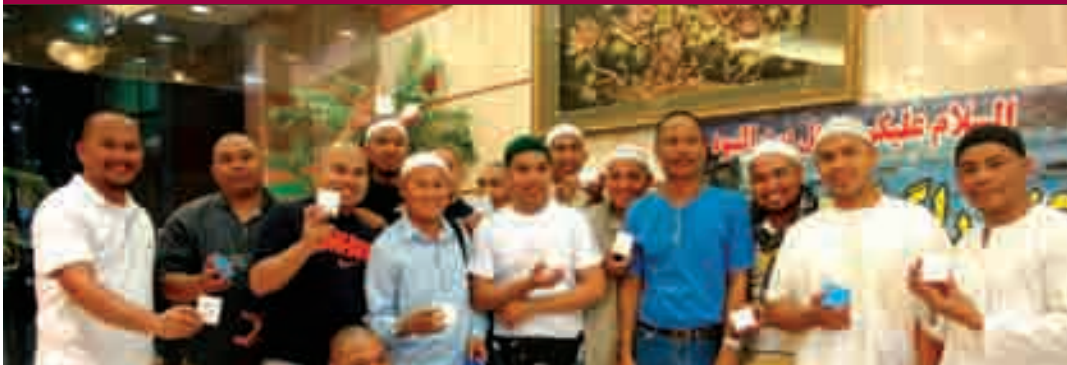
الفائزون في مسابقة المهتدين بمكة