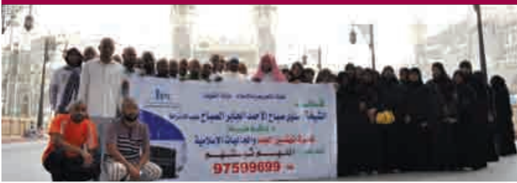
المهتدون والمهتديات في الحرم المكي