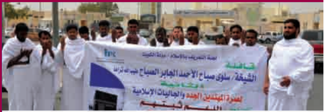
المعتمرون ارتدوا الإحرامات