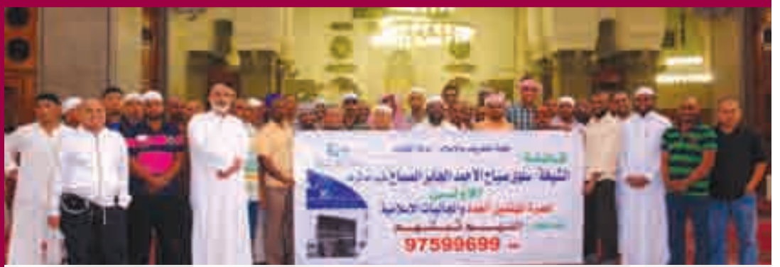
المهتدون في مسجد قباء