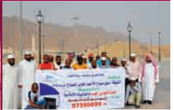
صورة تذكارية عند جبل أحد