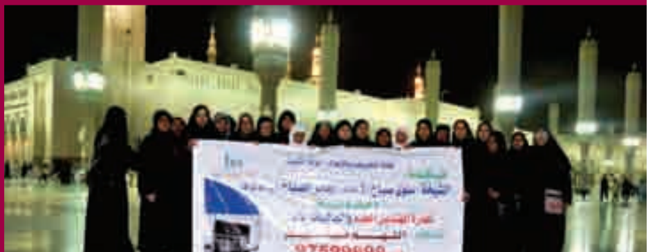
المهتديات في الحرم النبوي