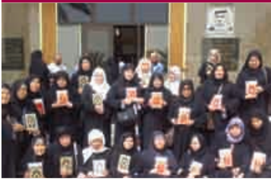
المهتديات في مجمع الملك فهد لطباعة المصحف الشريف