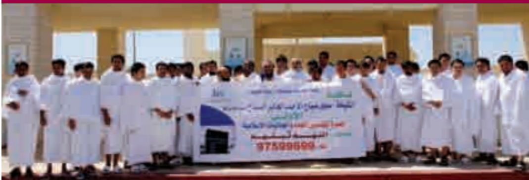
المعتمرين في ميقات قرن المنازل