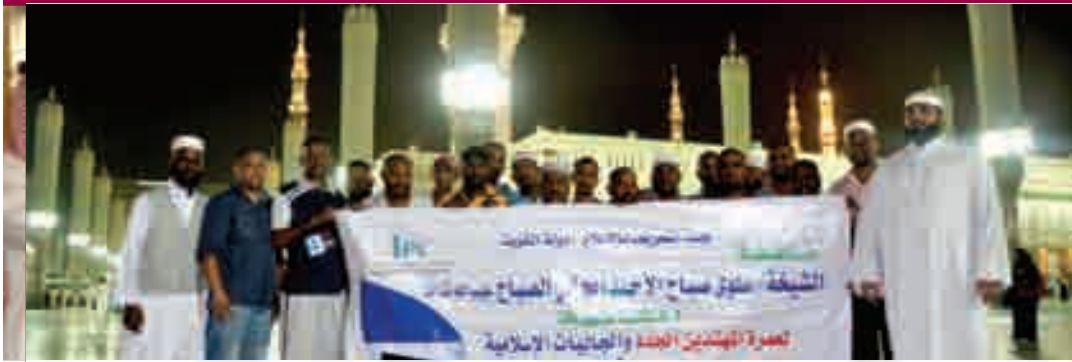
المهتدون في زيارة للحرم النبوي