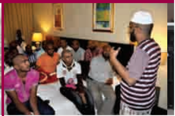
اجتماع الدعاة والمهتدون في مكة