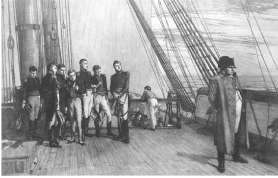
نابليون على ظهر الباخرة.