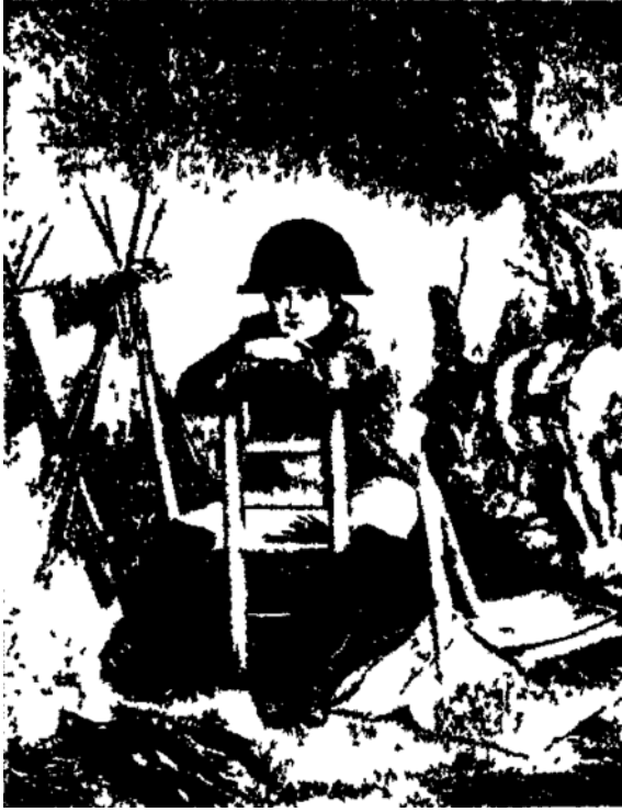
نابليون في واقعة أسترتلز.

اضطرب الأسبانيون لذلك فاستغاثوا بالانجليز فجاؤوهم ونشبت بينهم وبين الفرنسيين مواقع لم يغلب الانجليز فيها إلا في واقعة (فيتوريا) سنة ١٨١٣ وكان يرأسهم في تلك الموقعة (ولنجتن) القائد الانجليزي المعروف. لم يحضر نابليون هذه الوقائع بل انما كان قواده القائمين بها ولم يزر أسبانيا إلا في السنة الأولى من نشوب الحرب قال وهو ذاهب إليها: «اني ذاهب لأنظف أرض الجزيرة من تلك الثعالب الانجليزية التي غشيتها».