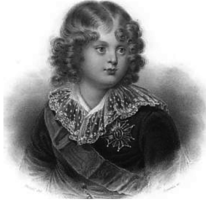
ابن نابليون - أو - ملك روما.