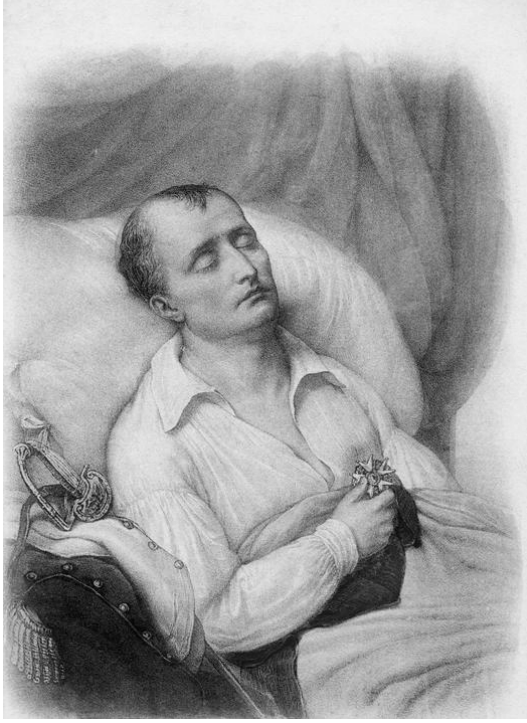
نابليون ميتا وكفه على وسام اللجيون دونور الذي أنشأه.