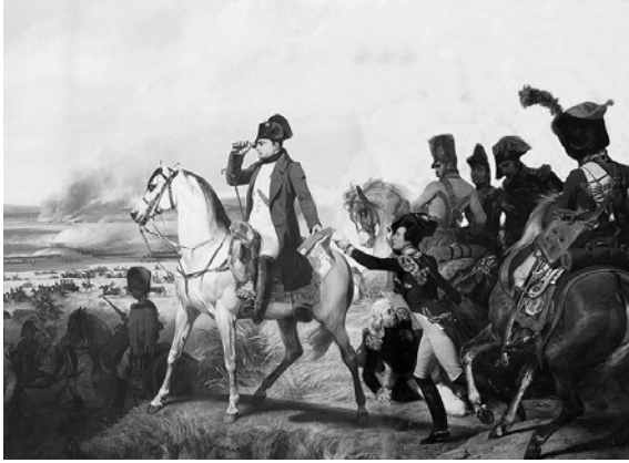
نابليون في واقعة واجرام.

يكد نابليون يستقر في ألبا يومين حتى توفيت زوجته المخلصة جوزفين فلما بلغه نعيها حزن عليها حزناً كثيراً.