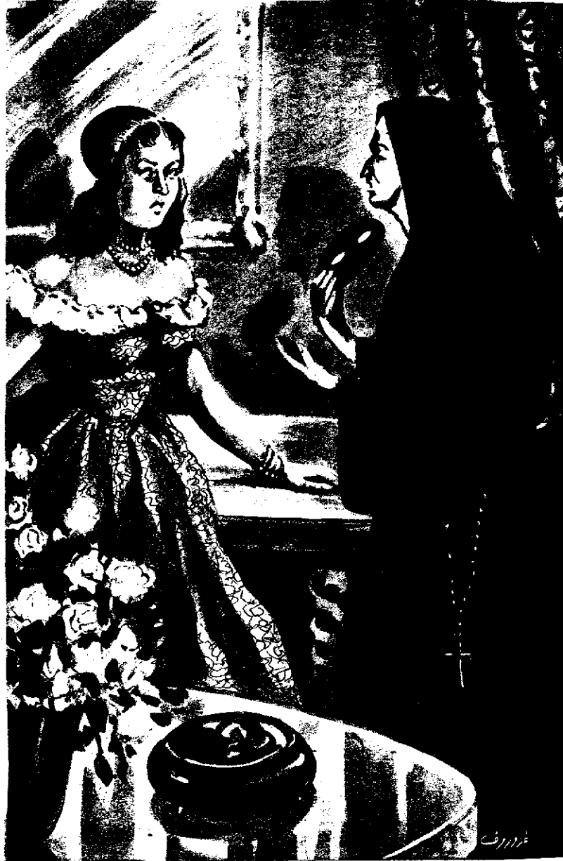
« وخلمت قناعها نجاة ، فصاحت الملكة في دهشة : مدام دي شيفرير ! »

تغمره السعادة وترتفع من حوالبه صيحات الفرح وشرب الانخاب ، وكان الشعب يهتف تحت الشرفات ، ورجال الحرس السويسري ، والفرسان ، والحرس الملكي يجوبون خلال المدينة ، والطلبة يمشون سكارى صاخبين ، وأزعجت هذه الأصوات ولي العهد الذي كان واقفا بين ذراعي مدام ( دي هوزاك ) مرضعة ، ولو أنه فتح عينيه لرأى تاجين في أسفل مهده ، وبغثة صرخت جلاتك صرخة عالية فجرت اليك مدام بيرون ، وكان الطبيبان يتناولان عشاءهما في الغرفة المجاورة لغرفتك ، بينما القصر هجره الحراس ، وفحصتك القابلة ثم صاحت صيحة دهشة ، وأخذتك بين ذراعيها ، وأرسلت لابورت توأ ليخبر صاحب الجلالة أن الملكة تريد أن تراه في غرفتها. وكان لابورت كما قد تذكرين جلاتك رجلا هادئا حاضر الذهن ، فلم يفاجيء الملك بما يزعجه ، بل اقترب من جلالتك وقال له وعلى شفثيه انتسامة : « مولاي . أن جلالة الملكة في سعادة عظيمة وستزداد سعادتها اذا رأت جلاتك » . وكان الملك في أشد حالات السرور والمرح فقام قائلا للجالسين الى المائدة : « ايها السادة : اني ذاهب لرؤية زوجتي » . وجاء جلالتك الى سريرك في اللحظة التي قدمت اليه مدام بيرون اميرا ثانيا في مثل جمال الأول وهتفت قائلة له : « مولاي . ان الله لا يشاء أن تحكم فرنسا ملكات » . وتحت تأثير الفرحة الاولى تناول الملك الطفل بين ذراعيه ورفع رأسه قائلا : « شكرا لك يا الهى ! »