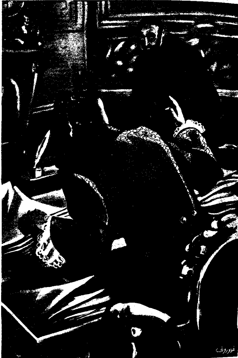
« وضرب الوزير المنضدة بقبضة يده ، ثم قال : إني لم أعد النائب العام ! »