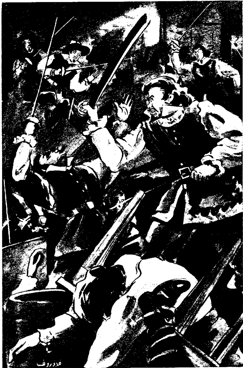
« وأخذ بورتوس الجبار يحطم جماجمهم بالقضيب الحديدى واحداً واحداً »

ثم وقف قائد الفرقة عند مدخل الكهف وقسم رجاله ثلاثة أقسام ، على أن يدخل كل قسم منها بعد الآخر مع اطلاق التيران فى كل اتجاه ، وقال لنفسه : « لا شك أننا فى هذا الهجوم سنفقد خمسة رجال آخرين وربما عشرة ، ولكننا آخر الأمر سننتخب على الثائرين . وعلى أى حال لن يتاح لرجلين اثنين أن يقتلا ثمانين رجلاً ! » وهنا قال له بيسكارا : « أرجو أن تسمح لى بالسير على رأس القسم الاول ! »