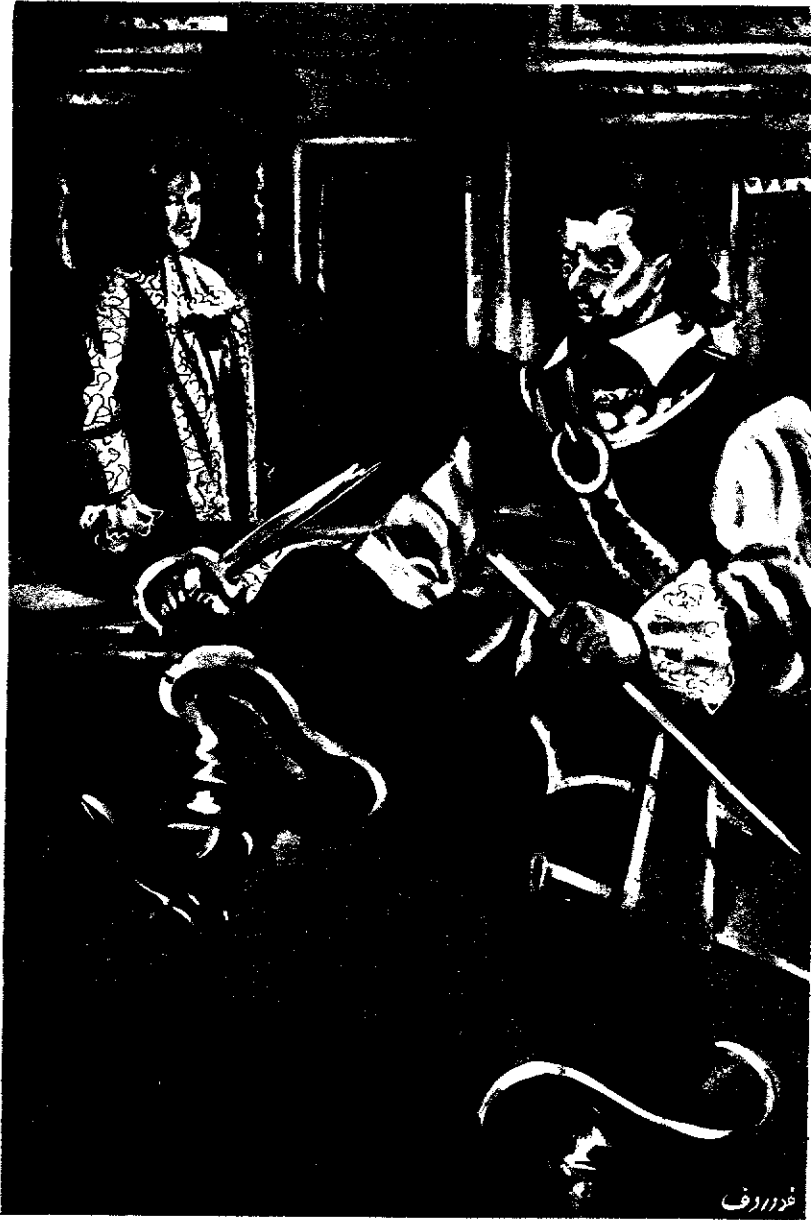
« وكسر الكونت سيفه على ركبته ، ثم ألقي بشطريه على الأرض ، وغادر الغرفة »

فقال : « ان شرف الملك يا مولاي من شرف نبلائه جميعا .. فاذا سلب الملك أحدهم ذرة من شرفه ، فلا شك أن جلالته يسىء بذلك الى نفسه ! .. وهذا ما يدعونى الى الاصرار على البقاء فى حضرة مولاي حتى تسوى هذه المسألة ، وليس يسع جلالتك الا الاستماع الى .. فأنا الآن شيخ لا يعيننى الا المحافظة على عظمة المملكة وقوتها ، ولقد طالما بذلت دمي فى سبيل أبيك وفى سبيلك دون انتظار أى جزاء .. وقد يزعم جلالتك أن أسألك حسابا