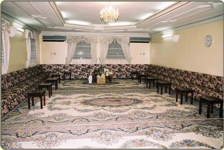
إحدى صالات الدروس والمراجعة