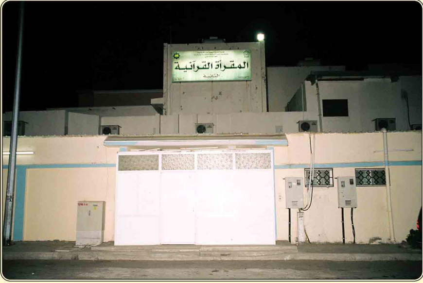
مبنى المقرأة من الجهة الأمامية