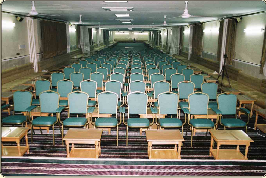
قاعة المحاضرات والحفلات مساحتها ٦٠×١٠م وتتسع لأكثر من (٦٠٠) شخص