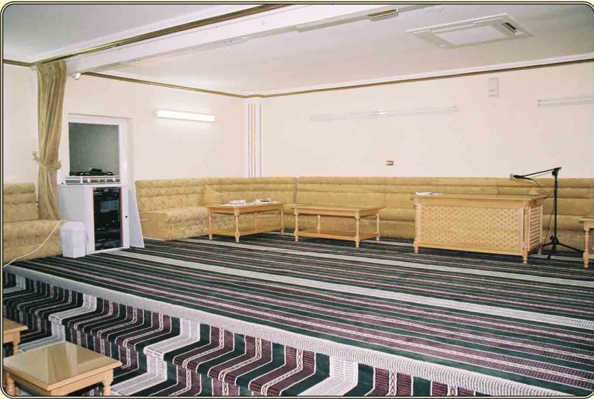
مقدمة قاعة المحاضرات والاحتفالات