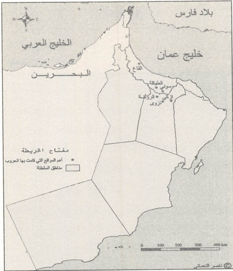
خارطة لأهم مواقع الحروب الأهلية في عمان عقب عزل الإمام الصلت بن مالك