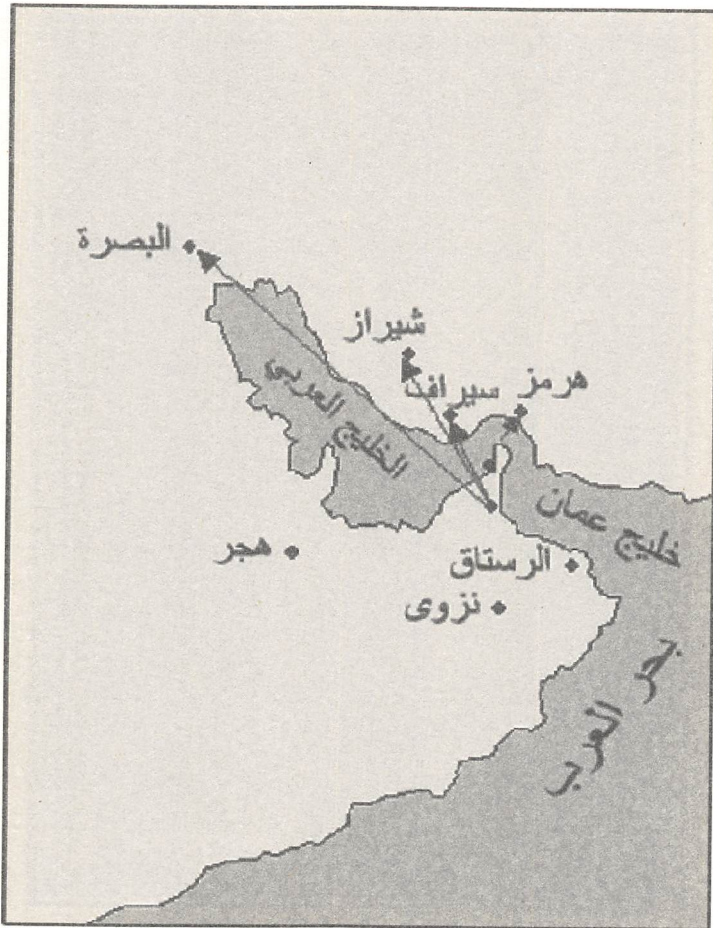
خارطة توضح هجرة بعض سكان المناطق الباطنة إلى هرمز، شيراز والبصرة عقب سماعهم بوصول حملة محمد بن بور إلى عمان