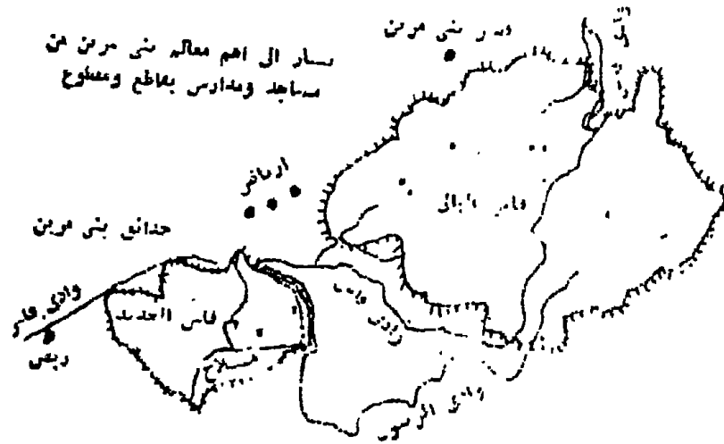
شكل 20 - مدينة فاس في عهد بني مرين .

جوليان : تاريخ أفريقيا الشمالية ، ج ٢ ، ص ٢١٨ .