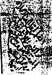
صورة الورقة الأخيرة للمخطوطة الأولى ( أ )

وكان الفزاع من ذر محمد الله وعونه في يوم الخميس ثاني شهر ذي الحجة الطرام الذي هو من شهر عام تسع وخمسين ومائة والف سنة فرمها جده صلى الله عليه وآله