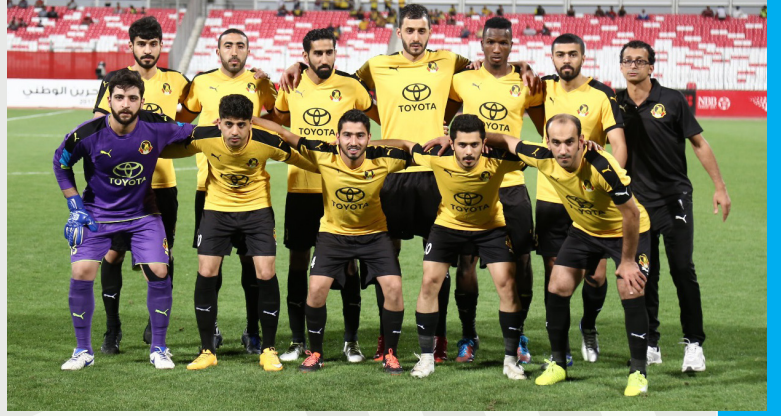
فريق النادي اهلي لكرة القدم

أثار قانون الـ 21 سنة والتي تم تطبيقها هذا الموسم من قبل الاتحاد البحريني لكرة القدم الكثير من الجدل بين الأندية واتحاد الكرة بسبب اجبار الأندية على هذا القانون الذي اعتبره البعض غير مجدي ولن يطور المنتخبات الوطنية. وكانت الكثير من الأندية قد تجاهلت هذا القانون طوال القسم الأول من الدوري مما أجبرتهم على تطبيقه في الدور الثاني وتأثر منها بعض الفرق كأهلي الذي لم يستوفي الدقائق المطلوبة ليتم تطبيق القانون وخضم 3 نقاط وتغريم النادي 5000 دينار.