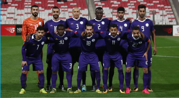
فريق الاتحاد لكرة

ولكن في مسابقة الدوري رغم بدايته الجيدة الا ان قطار البنفسجي توقف عن الانتصارات ليفقد توازنه ويهبط للمركز الأخير من ثم العودة إلى دوري الدرجة الثانية.