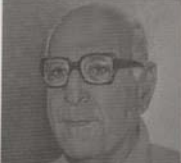
زكي نجيب محمود