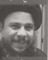
محمد باقر الصدر