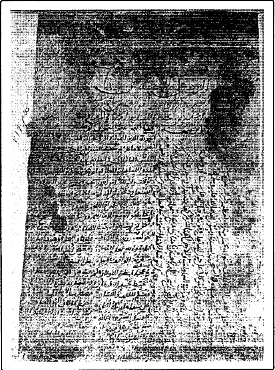
صورة غلاف النسخة الخطية من كتاب «الرد على المنطقيين» المحفوظة بخزانة الكتب الأصفية بحيدر آباد الدكن تحت رقم ٢١٩ من علم الكلام. وخفاء الصورة لانساخ الغلاف.