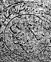
صورة الورقة الأخيرة من مخطوطة جامعة الإمام

من المالكية وغيرهم وان كانوا لا يعرفونه المصلحة لان سواد الاجتهاد وصلّى الرشد اماماً وقد اخرج وصلى الامام ابو يوسف خلفه وجماعة فقيل له وان كان الامام رضي الله عنه به رعا في جماعة فقيل له وان كان الامام قد خرج منه الدم ولم يرضى هل تصلي خلفه قال لم لا اصلي خلف الامام ما كذب وسعيد به النسب فليتاقل العاقل ما خرج عليه السنة الصالح وافل العلم ويتأمل ما قاله هذا الجاهل من التشيع على من ترك الجهر بالبسلة والتمس في الخور ما يلزمه في قوله ذلك وما تفتين كل على معترفة الله وقد تركه على تقليد القلبية انه من مدية مديدة وارضة غير مديدة وهو يشاهد منه غالب الناس من نية الشرايع وتضييع الفرائض وترك الطاعات وفعل المراتب اشياء تنفي الحد والاحصاء واسمها عندهم الاشراك بالله والقول بتجوزة على الله بلا علم ومع هذا اخبر عن انكاره يرضى عنه فاعلمه مع تصريح القرآن بتجريمه قال الله تعالى انما حرم الربى الفواحش ما ظلم منها وما بطن والاشم والبيعي بغيب الحق وان شرب كفا بالله ما لم يزل به سلطانا وان تقولوا على الله ما لا تعلمون اخبرها من الحجة رب العالمين والصلوة والسلام على اشرف المرسلين سيدنا وشيخنا محمد وعلى اله وصحبه اجمعين امين