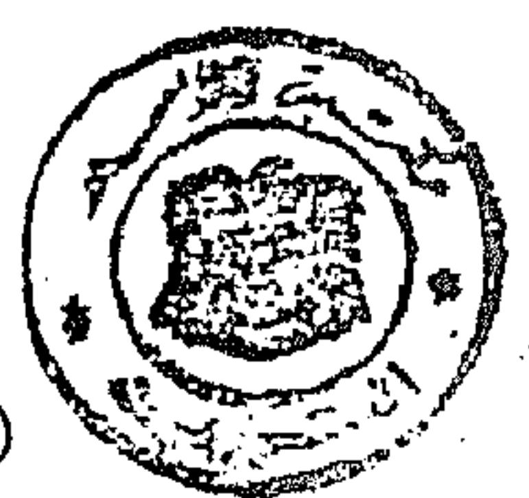
صورة غلاف الكتاب (وفيه عناوين الكتب المحفوظة في المجلد، وأولها كتاب تنزيه الأنبياء)