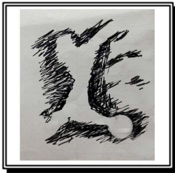
الشكل رقم (٢)