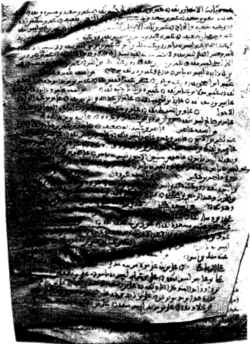
اللوحه الأخيرة من المخطوط