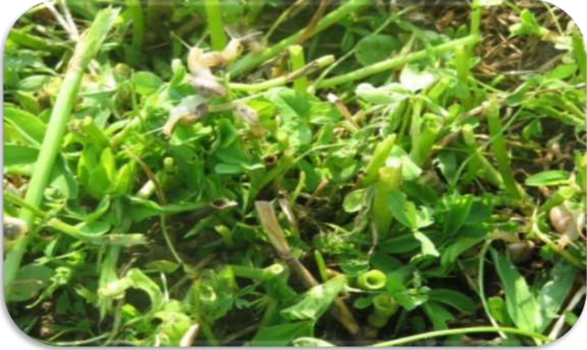
" إصابة القواقع لمحصول البرسيم "