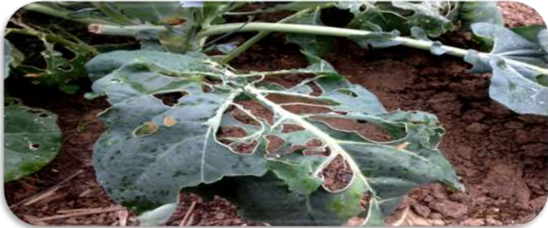
"اصابة نبات الكرنب بالقواقع"