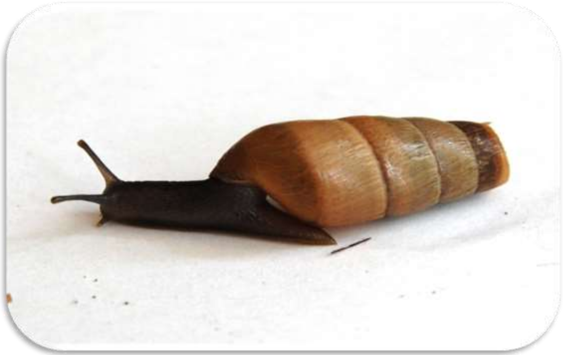
" قواقع مشطوف الصدفة "