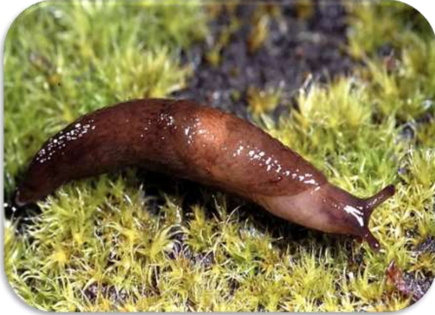
" صورته توضح شكل بزاقة Deroceras leave "