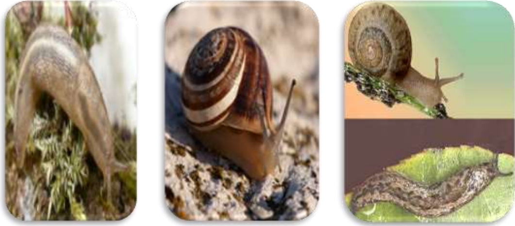
" صورة توضح القواقع الارضية والبزاقات "

مقدمة: تنتمي القواقع والبزاقات الأرضية إلى قبيلة الرخويات وهى عبارة عن حيوانات ذات أجسام رخوة غير مقسمة إلى حلقات لها رأس واضحة عليها زوجين من الملامس تسمى هذه الحيوانات بالبطن قدميات حيث تزحف على بطنها بواسطة قدم كبير عليه أهداب كثيرة ويقوم القدم أيضاً بإفراز مادة مخاطية تساعد الحيوان على سهولة الحركة، وتتميز القواقع عن البزاقات بوجود صدفة جيرية على الظهر تختبئ داخلها عند الخطر أو وجود ظروف بيئية غير مناسبة أما البزاقات فهى عارية .