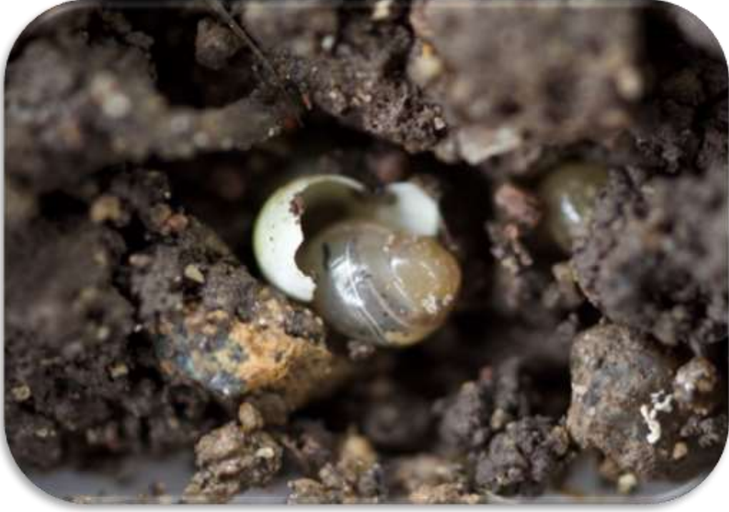
" لحظة خروج القواقع من البيضة "

تستمر في تكوين حلقات الصدفة بالتدريج الي ان تصل الي نهايتها عند بلوغها مرحلة النضج الجنسي وذلك في فترة تتراوح بين 10 - 12 شهر.