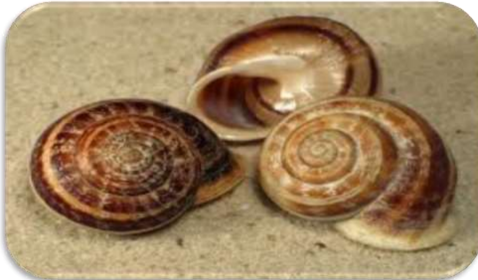
"قوقع الحدائق البني"