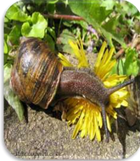
" إصابة نباتات الزينة بالقواقع "