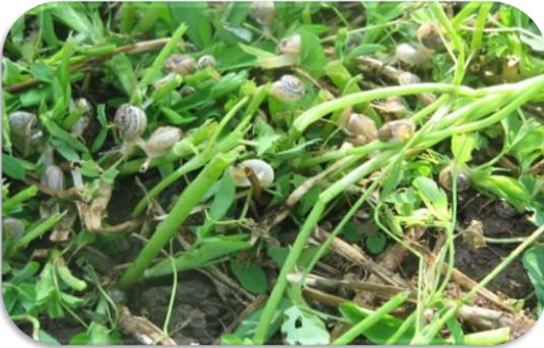
" قوقع البرسيم الزجاجي "