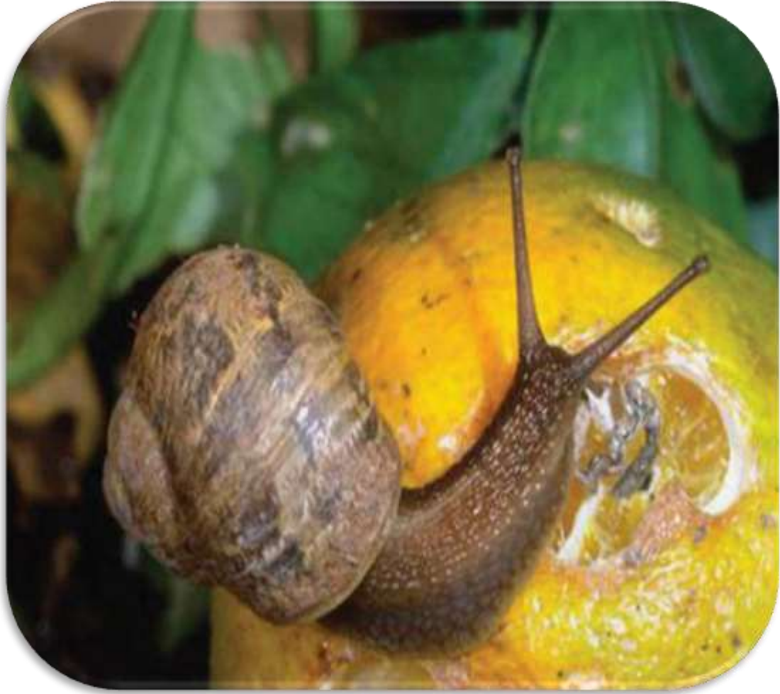
"اضرار يسببها القوقع علي ثمار الفاكهة"