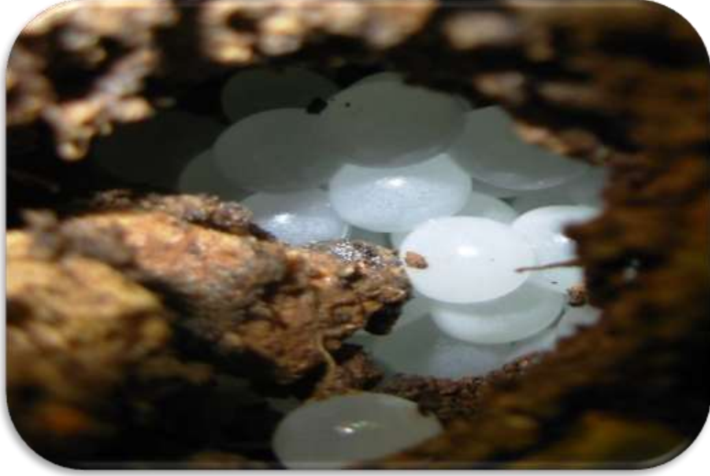
" صورة توضح بويضات القواقع الارضية بالتربة "

بعد حوالي 10 - 21 يوم حسب النوع يفقس البيض معطيا افراد صغيرة تشبه الامهات تماما ولكنها غير ناضجة جنسياً ويتم الفقس اواخر الخريف وبداية الشتاء. عند خروج الصغار مباشرة تتغذي علي غطاء البيض وعلي الشعيرات الجذرية للنباتات والمواد الدوبالية الموجودة في التربة.