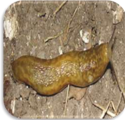
"صوره توضح شكل بزاقة limax flavus "