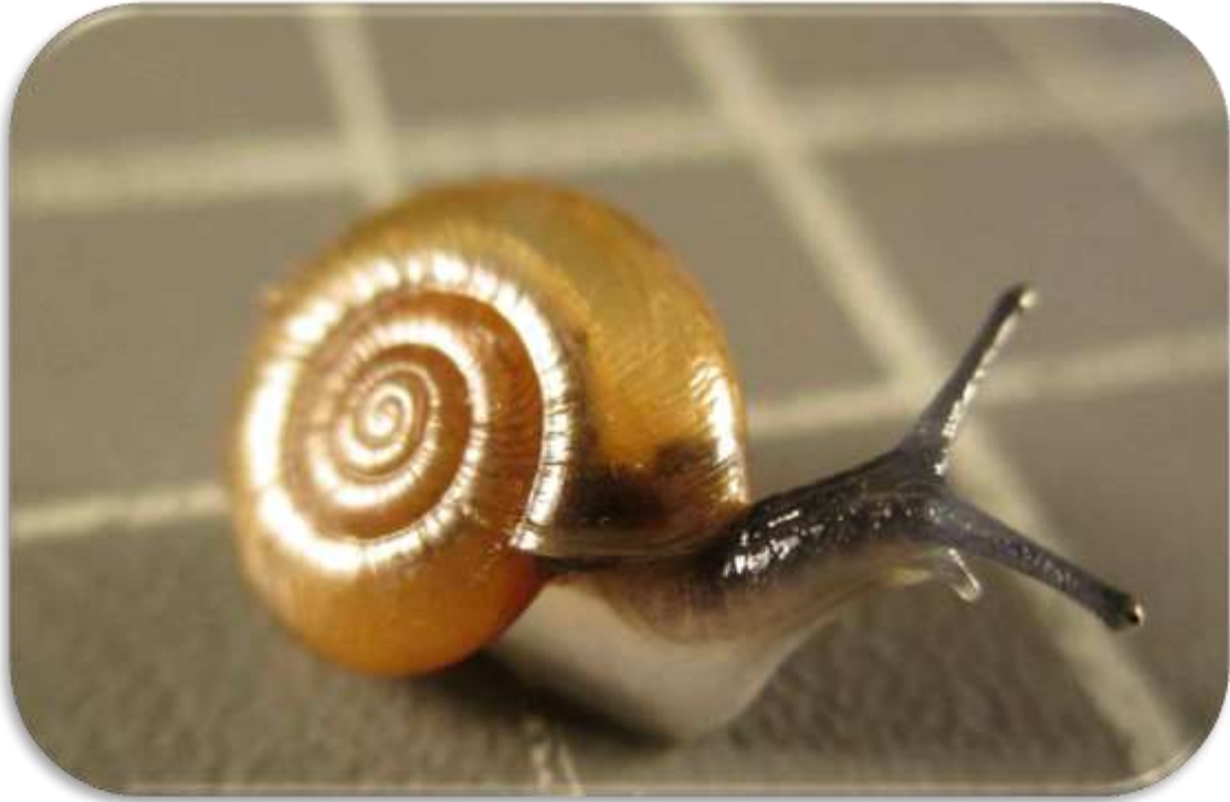
" قوقع زجاجي الصدفة "