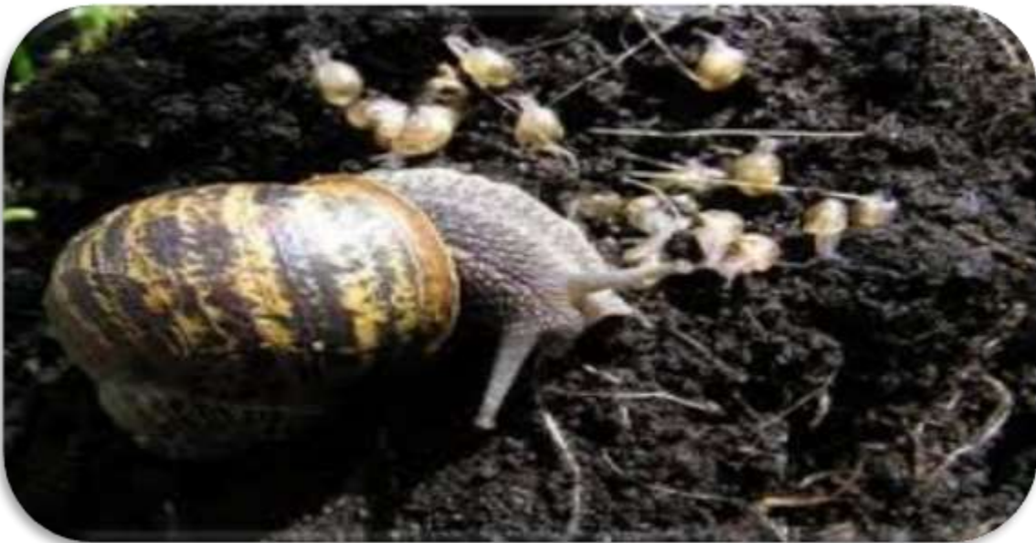
" صور توضح الفقس الحديث للقواقع الارضية "