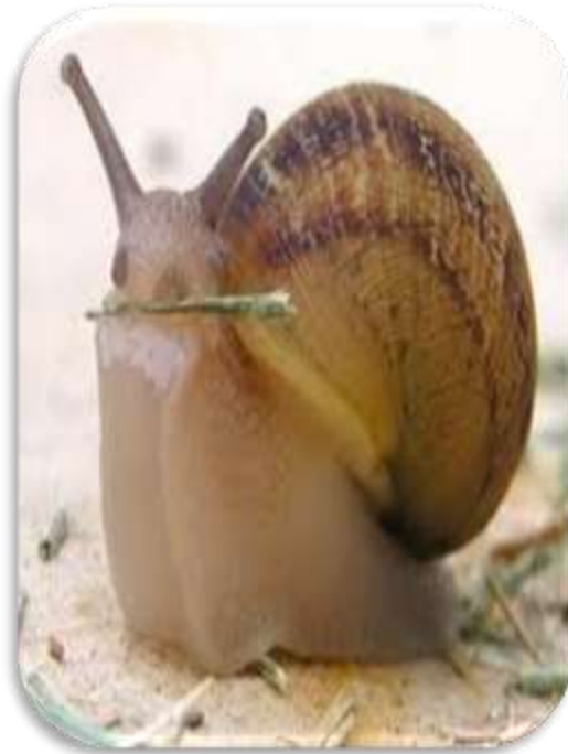
"منظر امامي للقوقع"