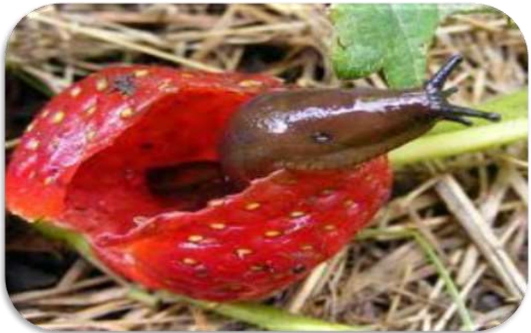
"إصابة القواقع الارضية لمحصول الفراولة"