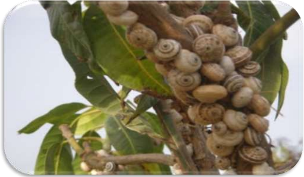
"إصابة جذوع الاشجار بالقواقع الارضية"