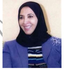
سعاد الصباح .