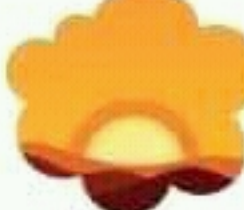
sunset غروب الشمس