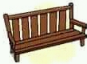
bench مقعد طويل لأكثر من شخص