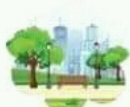
park حديقة عامة