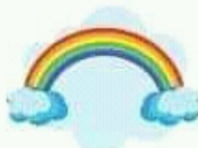
rainbow قوس قزح