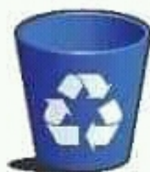
trash can سلة قمامة