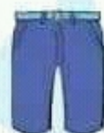
shorts بنطلون قصير