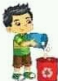
recycle يعيد استخدام