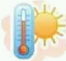
hot حار، ساخن