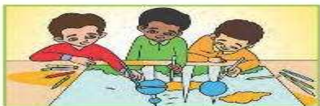
أنتم رسّامون ماهرون.