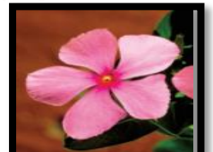
تستخدم الادوية المصنعة من زهرة عنقاوية المدغشقرية (كاثرانسيس روزيس) لعلاج سرطان الدم