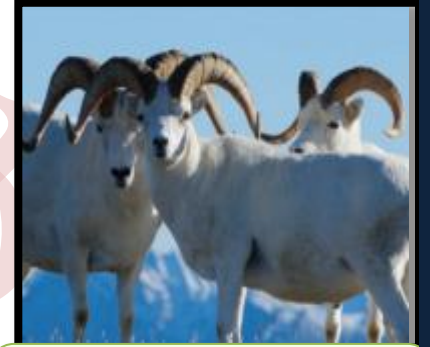
خراف دال (اوفيس دالي) في الاسكا