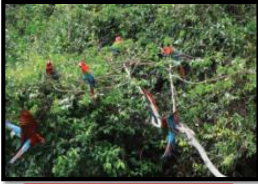
طيور استوائية في البيرو