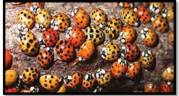
تظهر هذه الدعسوقيات الاسبوية المنقطة (هرمونيا او كسيريدس شكلا من اشكال التنوع المرئي بسبب الوانها المختلفة