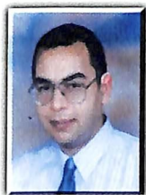
د. أحمد خالد توفيق