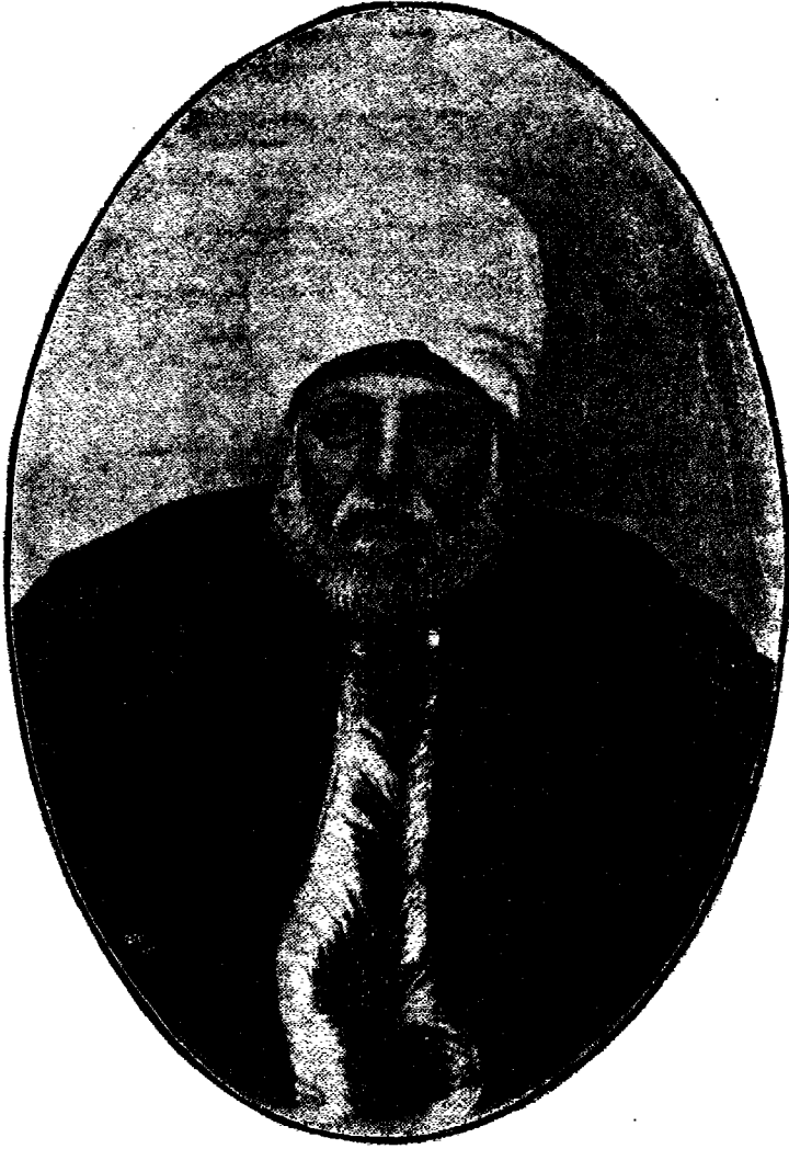
العلامة الشيخ محمد الزرقا