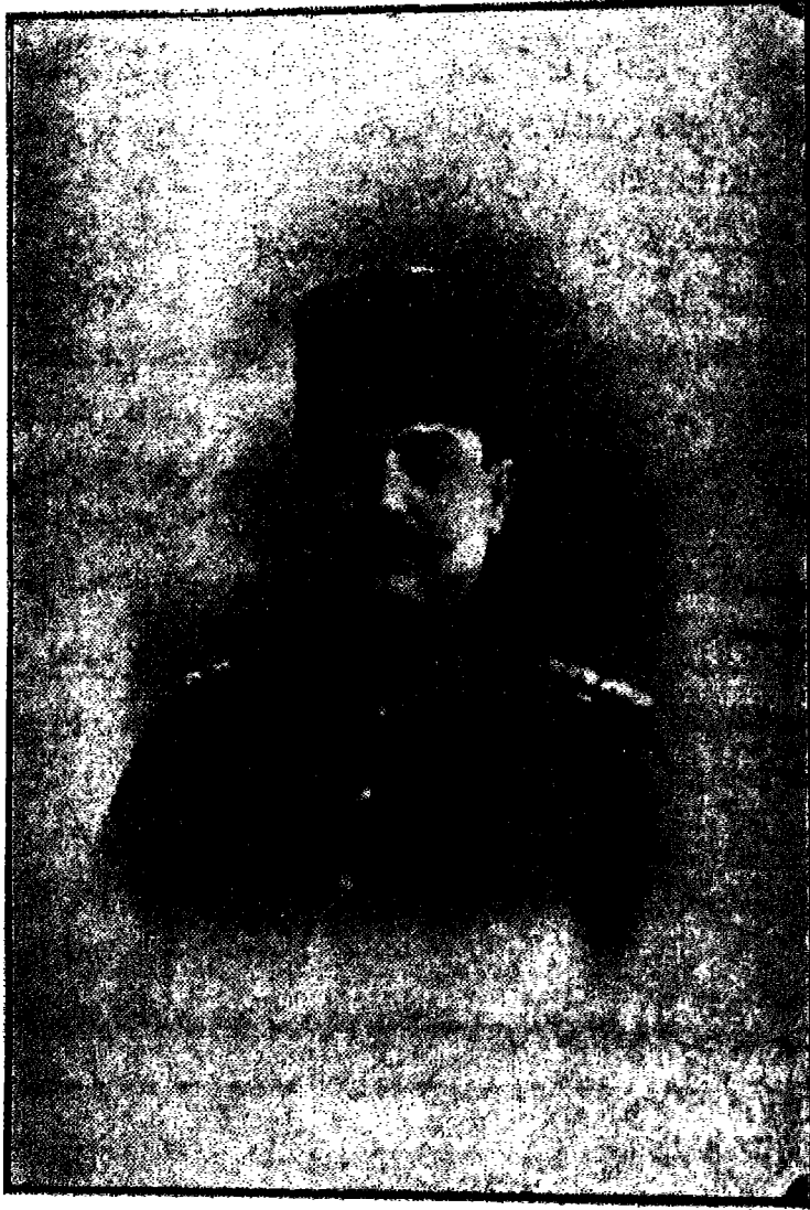
بطل اشقودره محمود کامل باشا