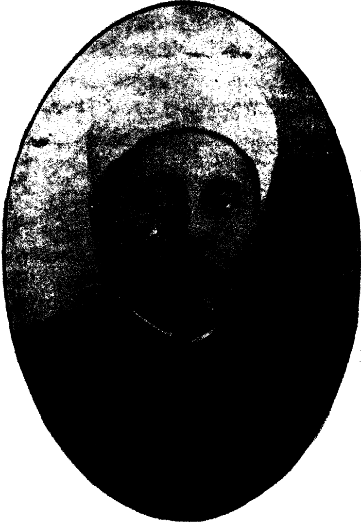
العلامة الشيخ بشير الغزي