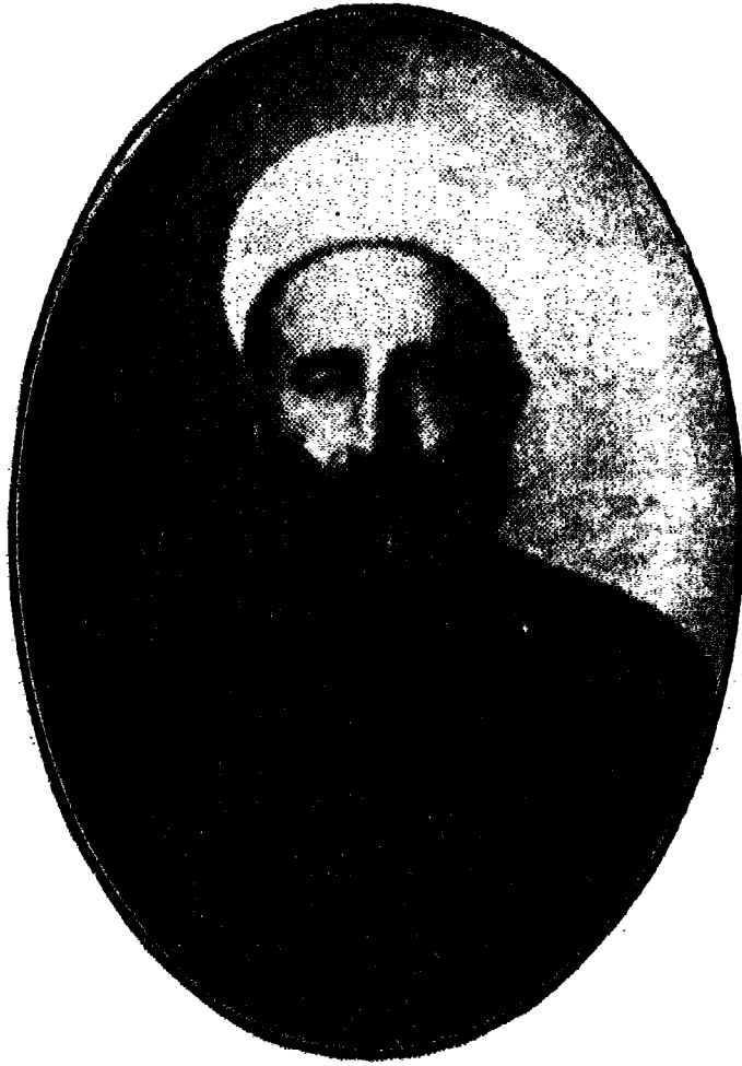
الشيخ محمد الحنفي