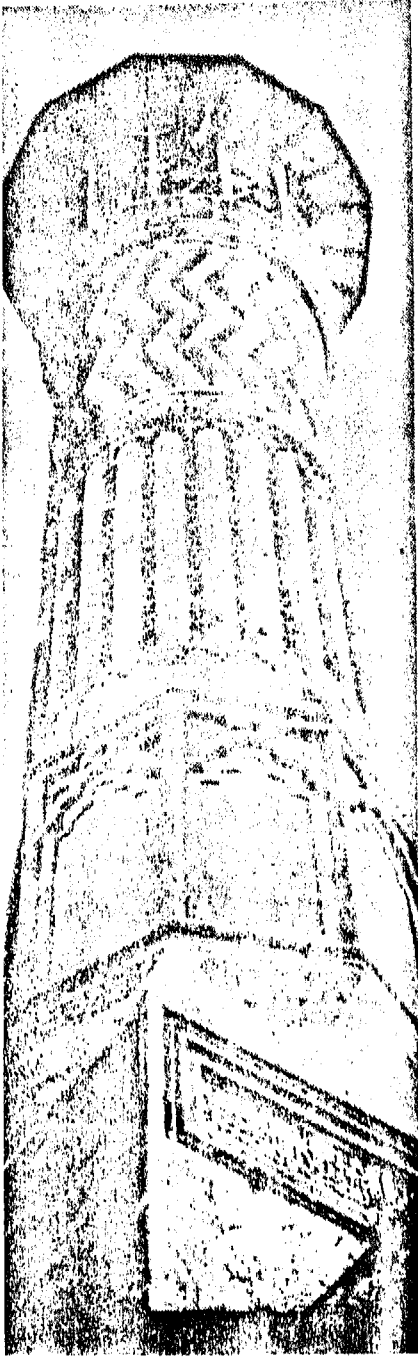
مئذنة جامع المهندار ( التفاصيل )