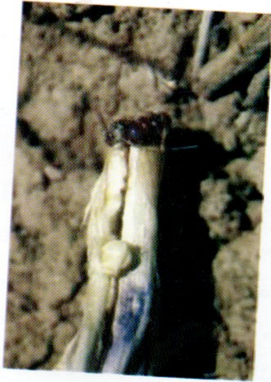
الصورة (3) حوصلة بق الشعير الدقيقي