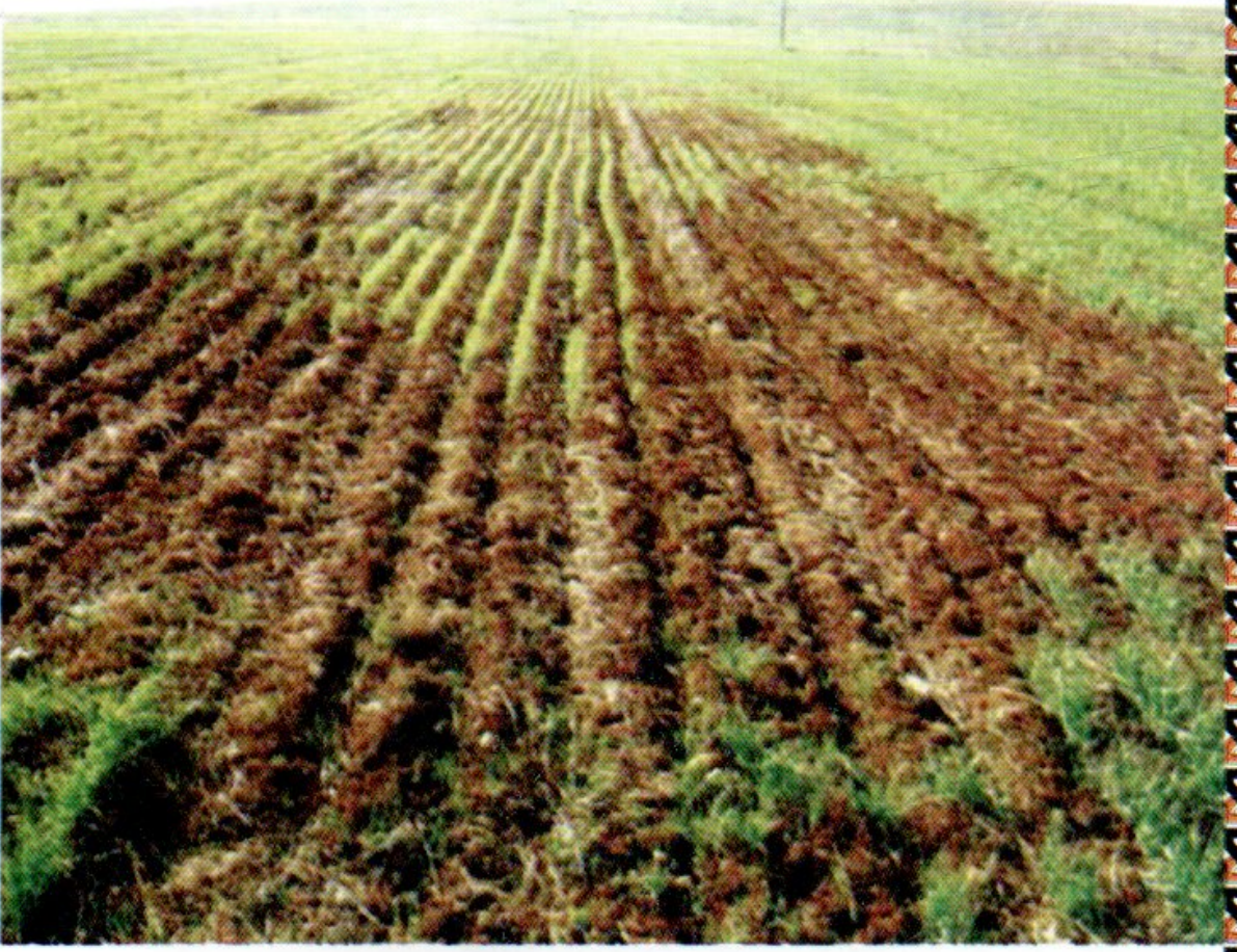
الصورة (1) حقل مصاب بحشرة بق الشعير الدقيقي ( لآلى الارض )