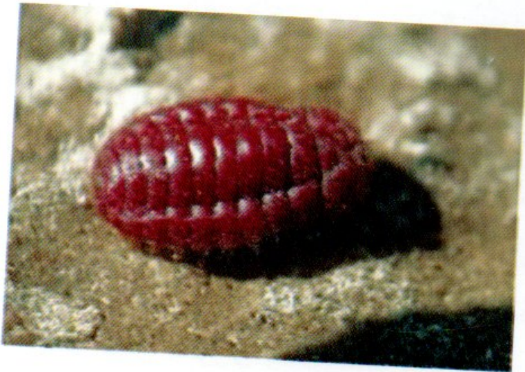
الصورة (4) : الطور الحوري لبق الشعير الدقيقي