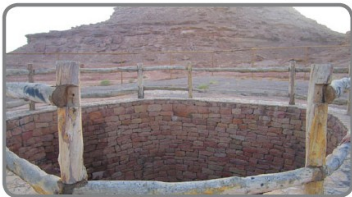
صورة لبئر رومة في المدينة المنورة

اشترى عثمان بن عفان (رضي الله عنه) بئر رومة ليوقفها على أوجه الخير، فلم تنحصر الأوقاف في بناء المساجد، فقد أقبل عليها الصحابة (رضي الله عنهم) لنيل الأجر، ولتوفي ما يحتاجه المجتمع، فعن ثمامة بن حزن القشيري قال: شهدت الدار حين أشرف عليهم عثمان فقال: «أنشدكم بالله وبالإسلام هل تعلمون أن رسول الله ﷺ قدم المدينة وليس بها ماءٌ يُستعذبُ غير بئر رومة، فقال: «من يشتري بئر رومة فيجعل دلوها مع دلاء المسلمين بخير له منها في الجنة؟»، فاشتريتها من صلب مالي، فجعلت دلوي فيها مع دلاء المسلمين؟» (رواه النسائي)، وأصله أخرج به البخاري في الشرب والمساقاة، باب: من رأى صدقة الماء، معلقاً. أشهد عثمان بن عفان (رضي الله عنه) النبي ﷺ والصحابة على وقفه عندما أعلن وقفه لبئر رومة سقاية للمسلمين.