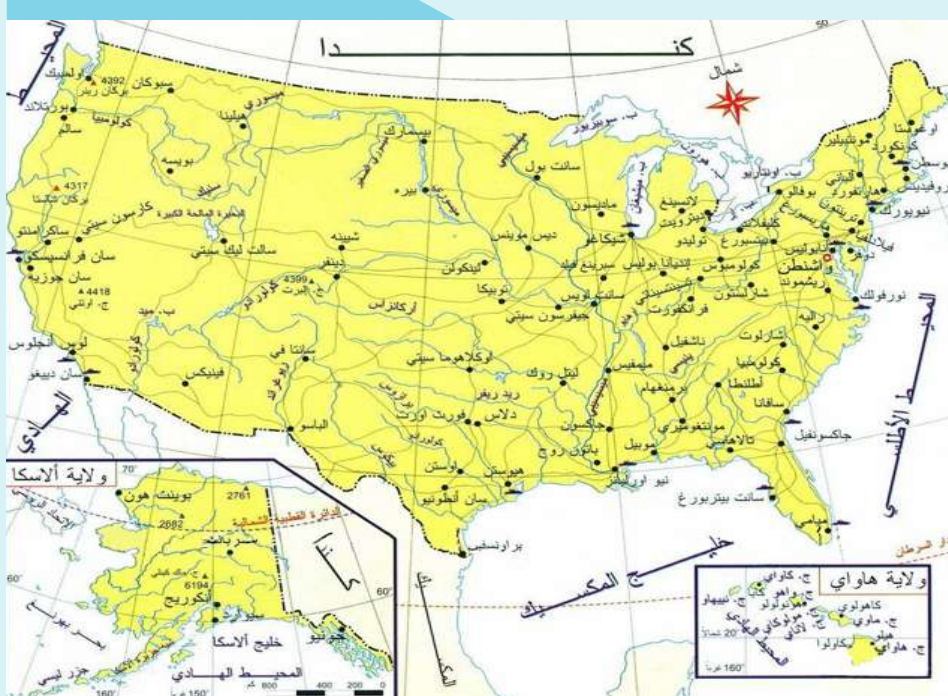
خريطة الولايات المتحدة الأمريكية