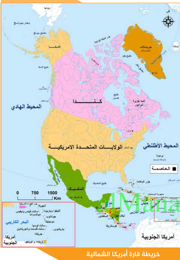
خريطة قارة أمريكا الشمالية

لا يمكن تحقق ذلك؛ لأن موارد الطاقة المتاحة لا يمكن إستخراجها بشكل كلي، وعدم التوافق في كيفية اختيار أماكن استخلاص الموارد المتاحة وعدم توزيع الموارد والبنية التحتية بالتساوي، وتفضيل هيمنة الأسواق المفتوحة، هذا بالإضافة إلى أن أمريكا الشمالية عرضة لإختلالات في إمدادات الطاقة.