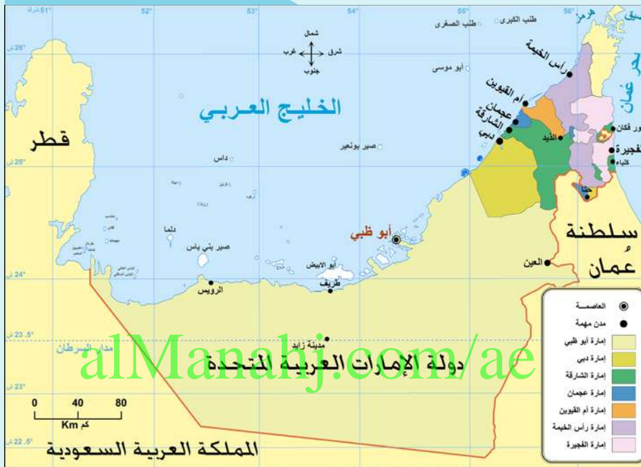
خريطة دولة الإمارات العربية المتحدة

أ تعاون مع زملائي في استكمال الجدول الآتي، بالاستعانة بالخرائط الآتية ومصادر المعلومات المتنوعة: