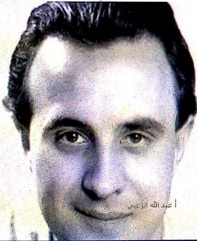
أعيد الله عز وجل

في الخارج أمام الباب « Draußen vor der Tür مسرحية (١٩٤٧). زهور الجرائب الحزينة « Die traurigen Geranien » قصص تركها ونشرت بعد موته (١٩٦٢). الخبز « Das Brot قصة قصيرة (١٩٤٧) ساعة المطبخ « Die Küchenuhr قصة قصيرة (١٩٤٧)