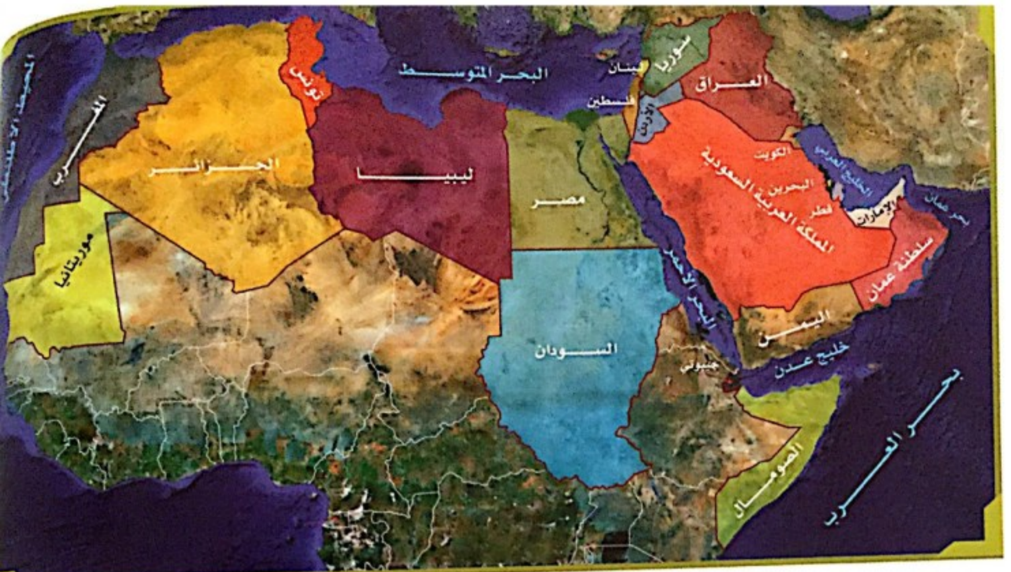
خريطة الوطن العربي السياسية