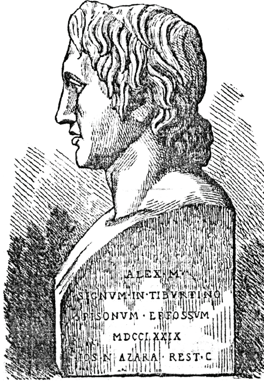
الإسكندر الأكبر وفتوحاته.

طعنة قضت عليه، وفرح الأثينيون بموت فيليب وقرّروا جهازًا بمكافأة بوسانياس بإكليل من الذهب جزاءً له على قتل فيليب؛ لأن كل أيلات اليونان كانت ضده.