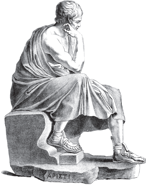
أرسطو الفيلسوف اليوناني.

وهناك شعراء آخرون كثيرون يونانيون بعضهم بعيد الشهرة مثل الأكرابون، وقد نظم عن المحبة والخمر، وبندار نظم قصائد عالية، وفيوقرنس وكان ينشد عن الرعاة والراعيات الذين كانوا في بلاده، وغير هؤلاء نظموا قصائد لأجل الألعاب منهم أخيلس وصوفوقليس وبوريديس وغيرهم.