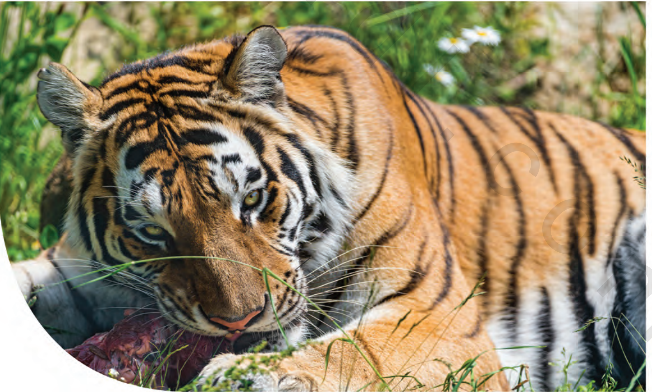
يَصْطَادُ وَيَأْكُلُ الْحَيَوَانَاتِ الْعُشْبِيَّةَ