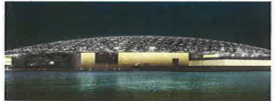
متحف اللوفر- أبوظبي

31) أي من الآتي الحقيقة الصحيحة التي تربط الصورتين؟