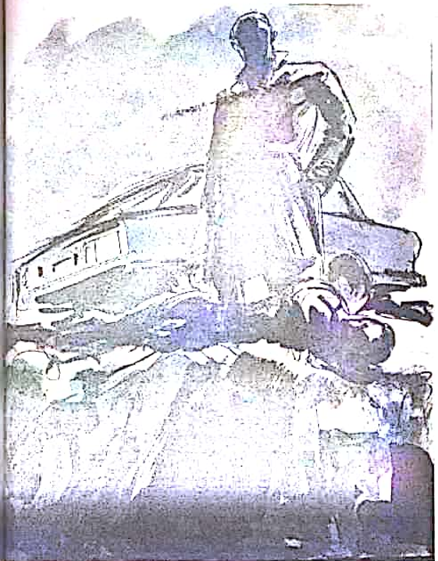
جرّ الجسد فوق الأرض الصخرية حتى أراحه على حافة الهاوية .