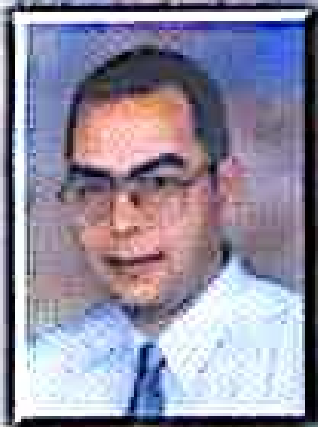
د. احمد خالد توفيق