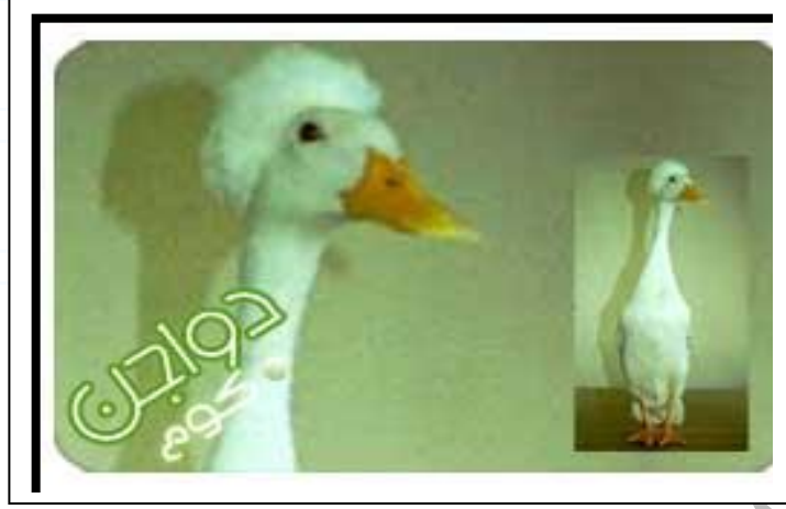
شكل البط البيلي