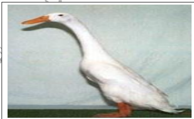
شكل بط العداء الهندي

يعتبر شكل البط في هذه السلالة مختلف نوعا ما عن بقية السلالات الأخرى حيث يمتاز الجسم بطوله الواضح وقد شبه البعض بطائر البطريق وقد نشأ هذا النوع في اسكتلندا منقولا عن منطقة الهند الشرقية. وهناك عدة طرز منه منها الأبيض والمخطط وهي سلالة خفيفة الوزن غير مستعملة في الأكل ولكن أمكن الاستفادة منها في إنتاج البيض نظرا لإنتاجها الجيد الذي يصل إلى حوالي ٢٠٠ بيضة سنويا ولون البيض أبيض أو بني . وزن الذكر ٢.٥ كجم بينما يصل وزن الأنثى إلى ٢ كجم فقط.