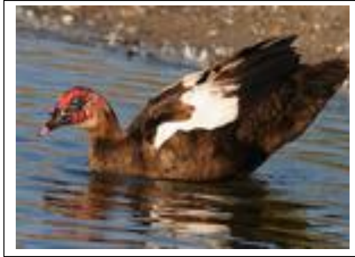
شكل ولون سلالة البط المسكوفي

أمريكي المنشأ ومنه الأبيض والملون ويتميز بوجود زوائد جلدية حمراء على الوجه ووزن الذكر ٤ - ٥ كجم والأنثى ٣ كجم ويعطى ٨٠ بيضة / الموسم ، متوسط وزن البيضة ٩٠ جم ولن القشرة ابيض مخضر.