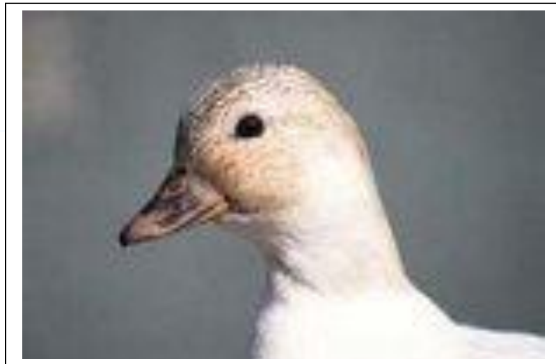
شكل بط الكال

بصفة عامة يحتاج لعناية خاصة ويميل الطائر للطيران يصل وزن الطائر في بعض الأحيان الي ١.٥ كجم.