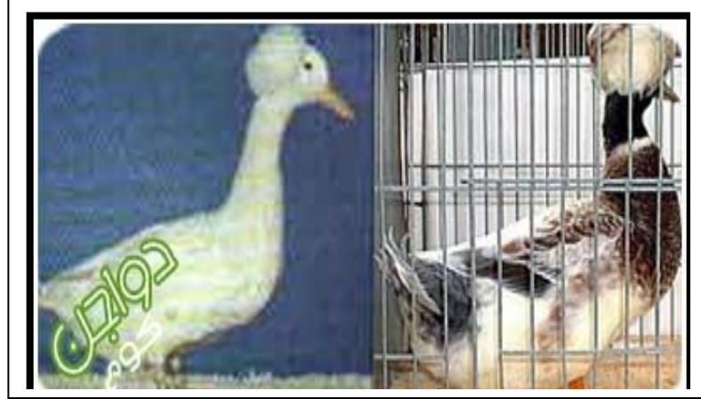
البط ذو القلنسوة