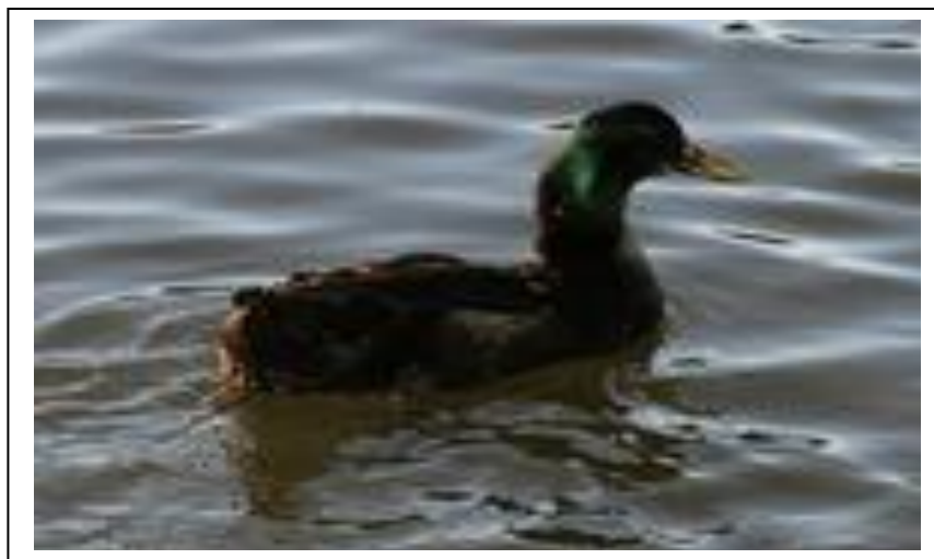
شكل بط الكايوجا

يصل إنتاج الإناث من البيض حوالي ٨٠ - ١٠٠ سنويا ويعتبر عدد قليل نسبيا نظرا لأنها سلالة إنتاج لحم ومدة حضانة البيض تصل الي ٢٨ يوم.