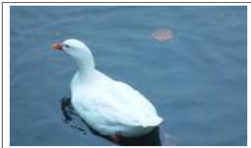
شكل ولون سلالة البط الليسبري

الخصوبة منخفضة ، لون الريش ابيض وكذلك لون الذبيحة، المنقار والأقدام ذات لون برتقالي.