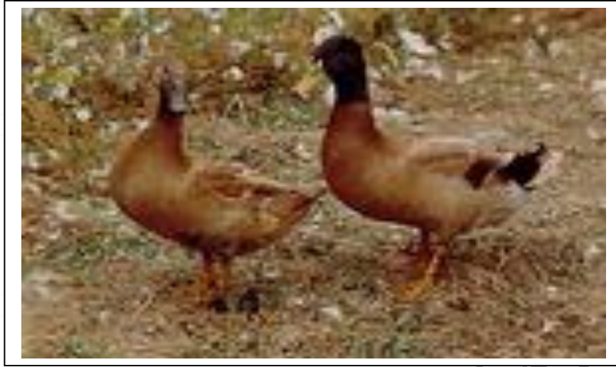
شكل بط الكامل