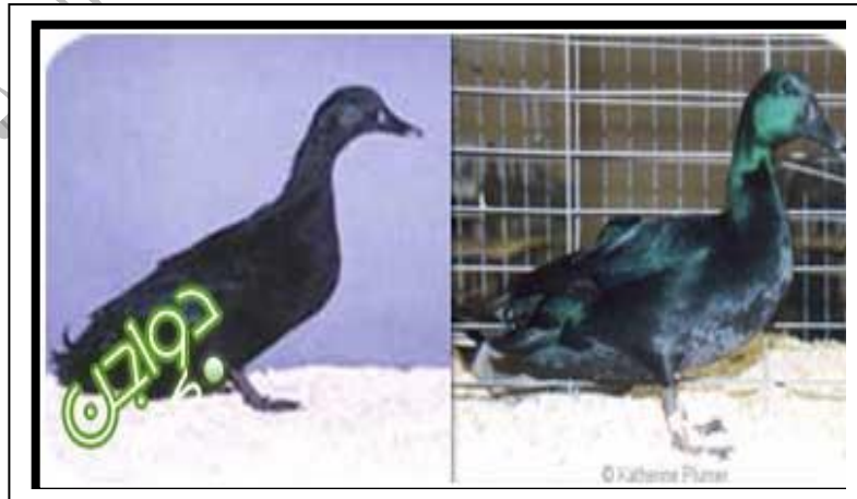
شكل ولون البط الهندي الشرقي

تتميز هذه السلالة بجمال المنظر وهي اكبر حجما من بط الكال يرجع أصلها الي مناطق داخل الولايات المتحدة . مواصفات الذبيحة جيدة بالرغم من اقتصار استعمالها في غالبية الأحيان علي الزينة لون الجسم من اسود إلي اسود مخضر والمنقار اسمر عاجي .