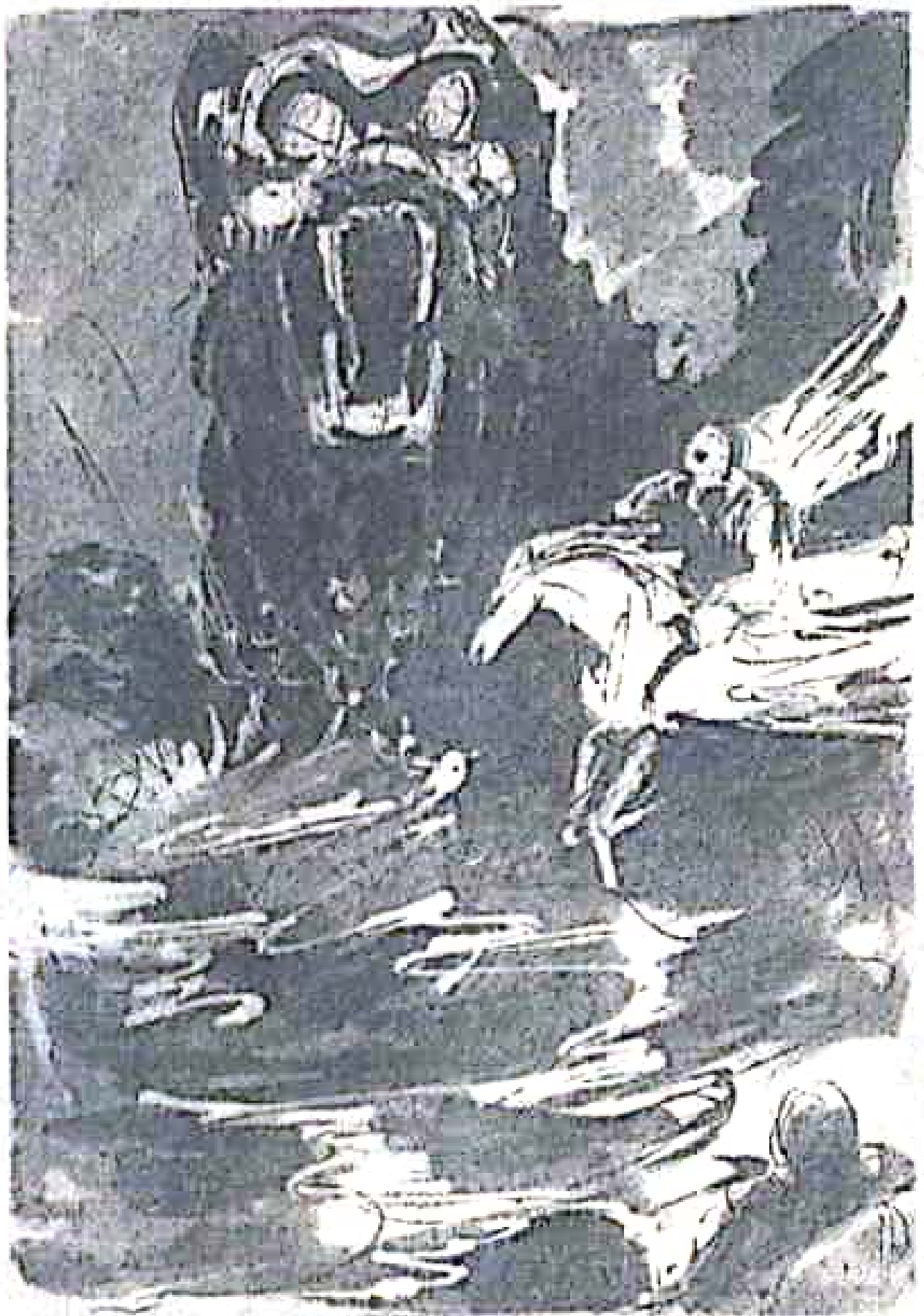
الحصان يقوم بدورة ثم اثنتين حول رأس الوحش . .