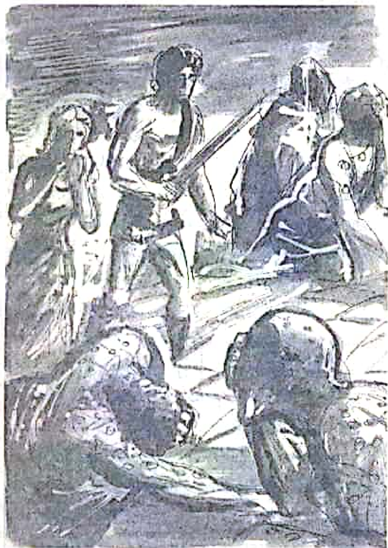
تمثيل فحكي - في بلاغة - حكاية العذاب البشري ..