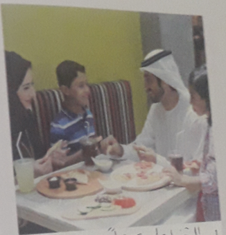
2 الاجتماع الاسري و الاهتمام بالطفل