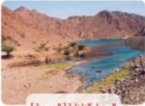
السهول الداخلية [ الحصوية ]

- اقرأ الصور الآتية بعناية، وأجيب عن المطلوب: