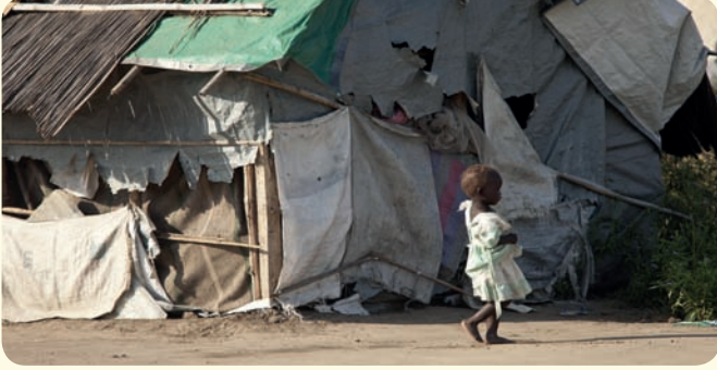
مخيم للاجئين في السودان

وغير ذلك من لوازم النظافة الصحية. كما سجل أكثر من 40 طفلاً مضخوبين بذويهم وذلك لبتدء بعملية لم شمل الأسر. تتنقل هذه البعثات في جميع أنحاء جنوب السودان، وهذا تذكير آخر بضرورة السماح لجميع العاملين في المجال الإنساني في البلد بالوصول إلى المحتاجين بصورة كاملة وآمنة ومن دون عوائق.