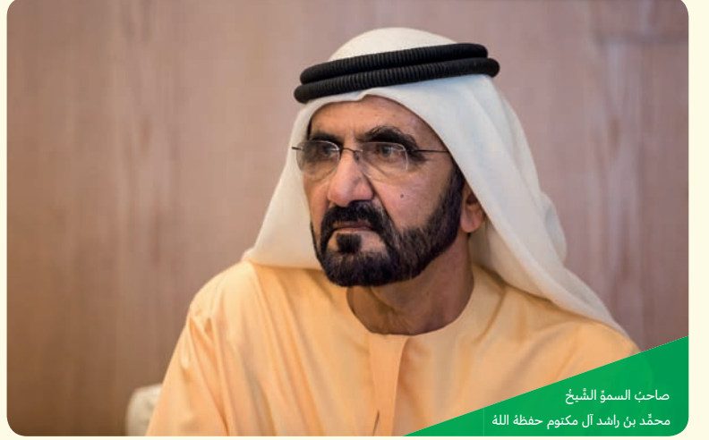
صاحب السمو الشيخ محمّد بن راشد آل مكتوم حفظه الله

أ. ما القيمة في هذه الرسالة التي تحكّم علاقة الدولة بالناس، وما أهميتها لمجتمع دولة الإمارات؟