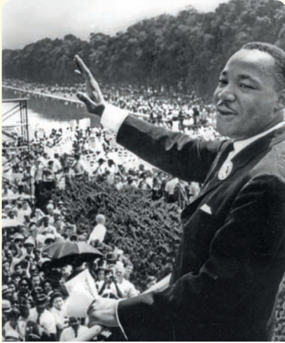
مارتن لوتر كينغ في واشنطن أثناء خطابه "لدي حلم"

منح كينغ في عام 1964 جائزة نوبل للسلام، وكان أول أفريقي يحصل عليها لدعوته إلى السلام عبر اللاعنفي، لكنّه اغتيل في عام 1968 بعد سنوات من النضال الطويل.