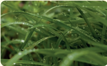
المطر نعمة للمخلوقات، فهو يزوي الثبات والحيوان والإنسان.

يمكن النظر لكل موضوع من زوايا مختلفة. تأمل الصور وأبد رأيك في وجهتي النظر المطروحتين عن المطر. علّل إجابتك ضمن مجموعتك.