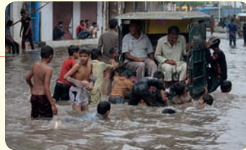
المطر نعمة على البشر، فهو يحدّث سيولا ويسبب حوادث سير وغرق.