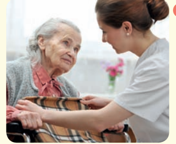
1 وصل عدد الأميركيين الذين قدّموا الرّعاية المجانية إلى المسنّين من محيطهم في العام 2009 إلى 42 مليون مواطنٍ ممّا وفّر حوالي 450 مليون دولارٍ هي تكلفه هذه الرّعاية.

- الصورة (2): يهمل العديد من المجتمعات المسنّين ولا يحترم حقّهم في العيش بكرامة في ظلّ تراجع قدراتهم الجسدية والصحية على الإنتاج. هذا الواقع يدلّ على عدم وعي الأفراد والفئات المجتمعية في هذه المجتمعات، فهم سيلقون المصير ذاته عند تقدّمهم في العمر وإن اختلفت فرص العمل المتاحة أمامهم. بالتالي فإنّ هذه المجتمعات تعاني من الشعور بالإحباط والكآبة وعدم الأمان. إنّ عدم الاهتمام بالمسنّين من أبرز الدلائل على غياب الترابط الاجتماعي والتعاطف في المجتمع.