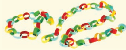
سلسلة من الورق الملون