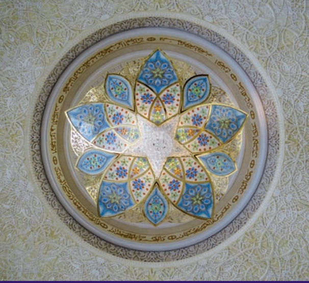
مستوحى من جامع الشيخ زايد الكبير، أبوظبي

تصميم يعكس مفاهيم الثقافة المحلية والمجتمع المعاصر والمواطنة العالمية.