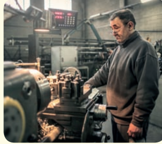
2 ما زال المسنّون يعمّلون في ظروف قاسية لتخصيل لُقمة عيشهم في العديد من المجتمعات.

أ- يطلب المعلم من الطلبة العمل في إطار مجموعات ثنائية على تحليل الصور واستخلاص تأثيرها في المجتمع. - الصورة (1): الرعاية المجانية تؤدي إلى حصول الجميع على الاهتمام الذي يحتاجون إليه بما أنّ الدولة لا تتحمّل التكلفة المادية لتأمين الرعاية. فأغلب الدول التي لا يحصل المحتاجون فيها على الرعاية بكافّة أشكالها يكون السبب الأول في ذلك عدم القدرة على تحمّل الأعباء المادية الكبيرة. ينتج عن الرعاية المجانية توفير مبالغ طائلة من الموازنة في البلد المعني يمكن الاستفادة منها في تطوير قطاعات أخرى ممّا يسهم في تقدّم البلد وتحقيق الرفاه للمجتمع. كما أنّ الرعاية المجانية من أبرز الأعمال التي تدلّ على التعاطف في المجتمع.