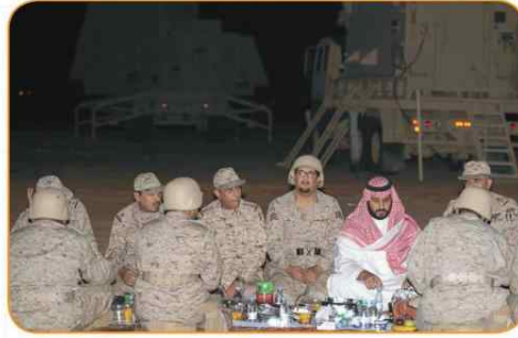
جنود مرابطون يتناولون الإفطار في شهر رمضان المبارك مع صاحب السمو الملكي ولي العهد الأمير محمد بن سلمان حفظه الله .